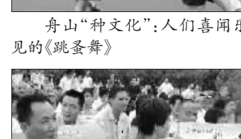
余姚市向低保户和外来务工人员发放文化消费券