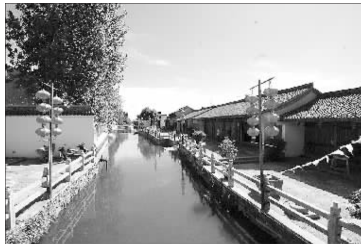
宁波市非物质文化遗产展示中心