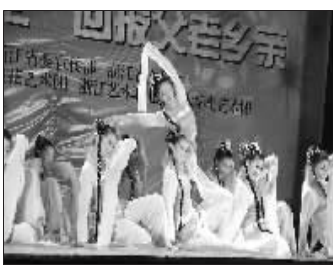
“钱江浪花”直通车赴基层演出

甬剧《典妻》、民族音乐剧《五姑娘》等一批力作。把农村题材纳入舞台艺术生产、电影和电视剧制作、各类书刊和音像制品出版计划,充分发挥城市文艺创作队伍的优势,创作了一批反映当代农村生活、农民喜爱的作品,如《小村故事》、《乡里新韵》、《九斤姑娘》等。同时,以重大比赛活动促进农村文艺创作生产,陆续举办了浙江省农民文化艺术节、浙江省民间艺术节、浙江省广场文化艺术节等重大节庆活动。