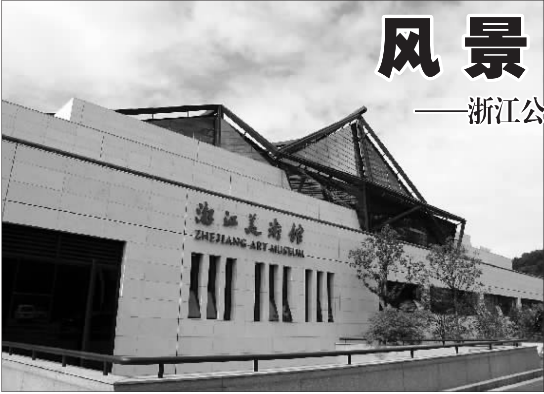
浙江美术馆开馆迎客

【相关链接】2006年,浙江省各级财政对文化的投入总额(不含对基本建设的投入)达17.26亿元;2007年达21.9亿元;2008年则超过了26亿元,人均文化投入从“十五”期末的30.38元上升到了2008年的51.05元,位居全国前列。随着财政每年通过转移支付用于农村文化建设的投入从“十五”期间的1500万元增至目前的1.58亿元。据统计,浙江省文化事业费占财政支出的比重连续8年位居全国第一。