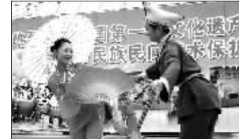
舟山“种文化”:人们喜闻乐见的《跳蚤舞》