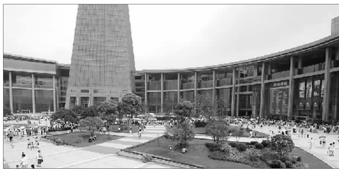
西湖文化广场·自然博物馆观众云集

三是鼓励“创文化”。浙江坚持贴近实际、贴近生活、贴近群众,大力实施文化精品工程,开展青年艺术人才培养“新松计划”,加强文艺人才培养。近年来涌现出了越剧《陆游与唐婉》、昆剧《公孙子都》、