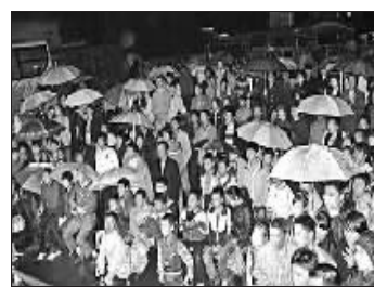
群众冒雨观看“钱江浪花”节目