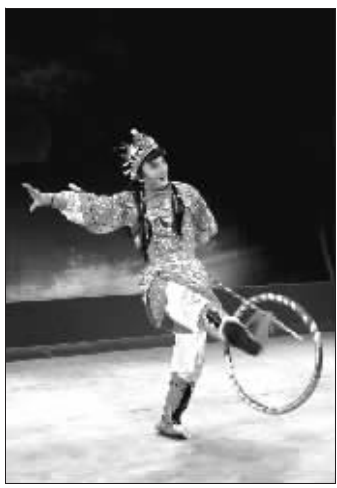
翁国生主演的《哪吒》