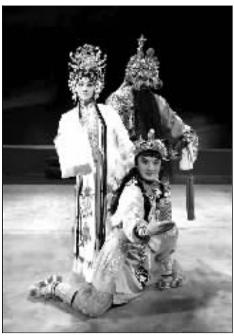
神话京剧《哪吒》剧照