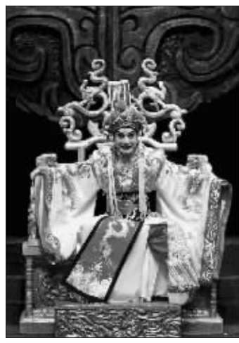
翁国生主演的中国版《王者俄狄》