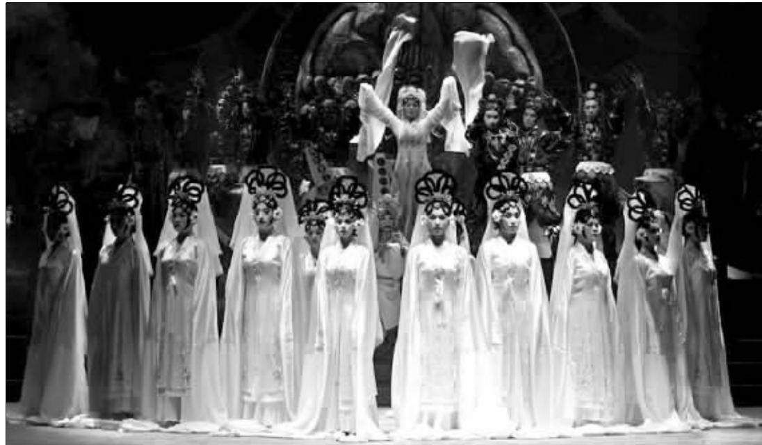
《国色天香》戏曲综艺晚会现场