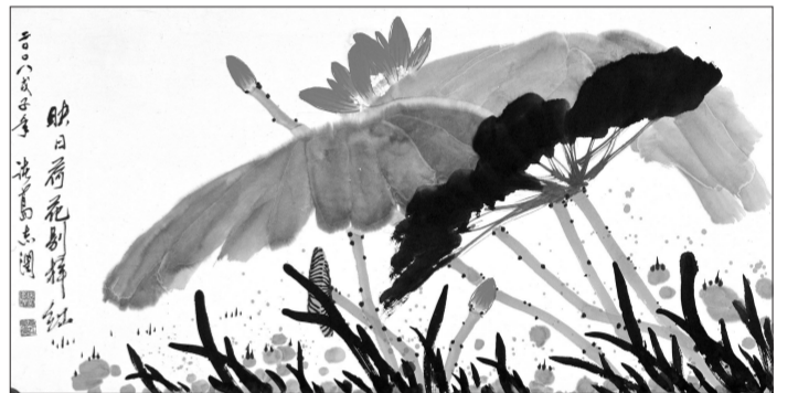
展期: 6月3日至13日 展地: 辽宁省博物馆

此次展览共展出著名画家诸葛志润自20世纪80年代以来的绘画精品45件(组)。展览结束后,所有参展作品将捐赠给辽宁省博物馆,以代表国家永久收藏。