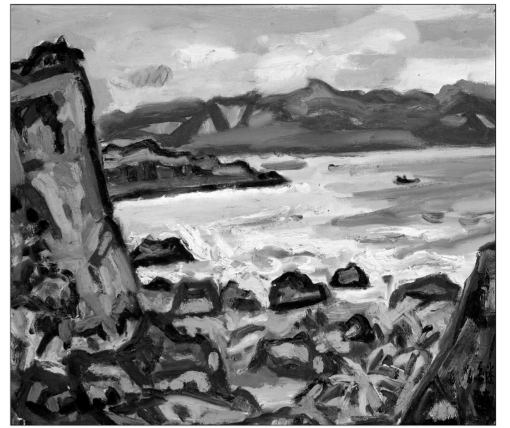
展期: 6月4日至29日 展地: 上海美术馆

作为“两岸城市艺术节”的系列活动之一,去年10月,上海美术馆率先在台北举办“上海故事——上海美术馆馆藏展”,以近60年来海派文化的发展为立足点,讲述上海面向世界的多元文化格局,反映上海这座城市所孕育出的特有的文化性格和文化故事。与此相呼应,今年6月,“两岸城市艺术节——台北文化周”将在上海隆重举行。其中,“台湾行旅——台北市立美术馆典藏品特展”展出台湾自20世纪50年代以来的优秀艺术家的精品力作50件,这些极具台湾本土特色的艺术作品,展现一段段关于台湾的文化风情,并打开一扇了解台湾的窗口。