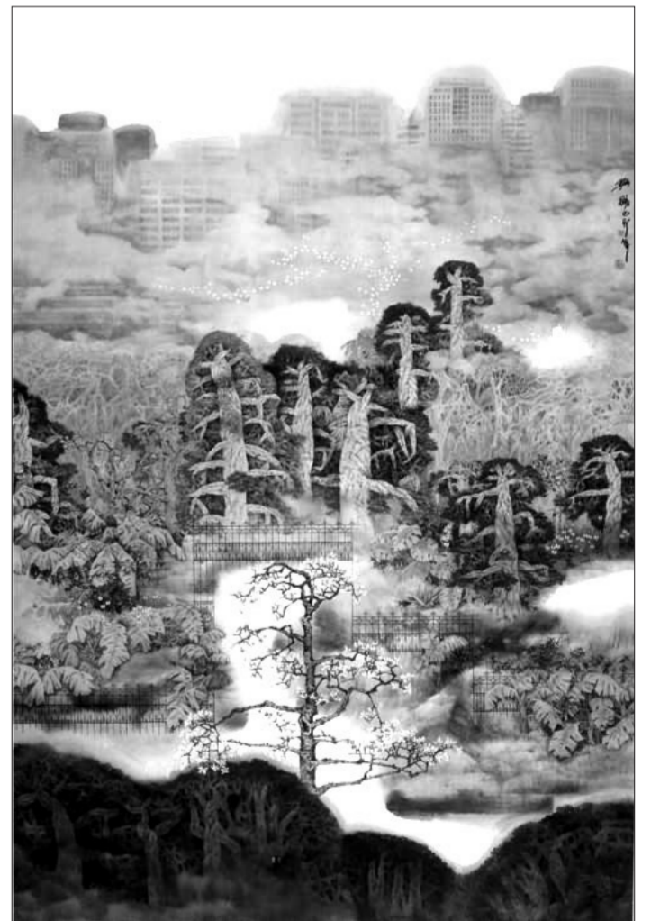
展期: 6月8日至30日 展地: 深圳美术馆

从上世纪末起,艺术家樊枫开始尝试传统的水墨画技法来描绘现代都市生活,陆续创作了一大批反映都市景观、城市生活、城市历史变迁等方面的作品,受到了广泛的关注和赞誉。与那些抽象的都市水墨不同,在很多作品中,樊枫所描绘的对象是他自己非常熟悉的都市武汉。本次展览汇集了其都市水墨画新作近90件,展示了当代水墨艺术别具一格的探索精神。