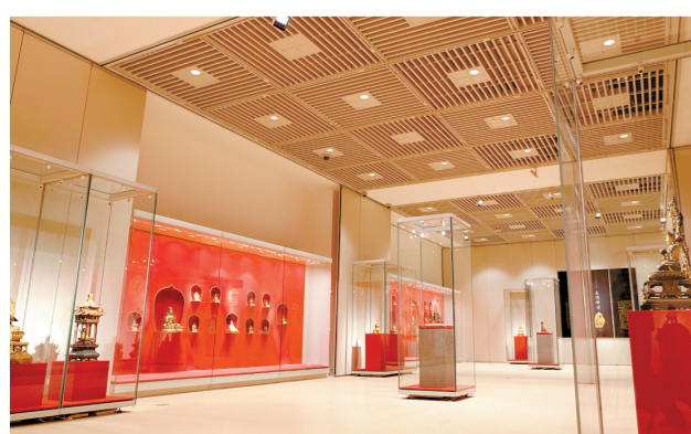
特展馆“金色中国”展厅