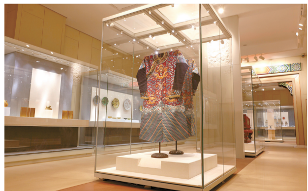
特展馆“清宫陈设展”展厅