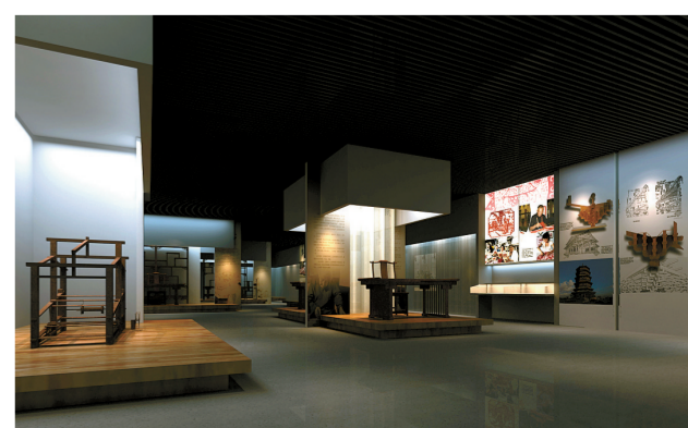
非遗馆“江苏非遗展”展厅

11月6日,我国第一座大型综合国立博物馆南京博物院二期改扩建工程完工并将全面开放。作为国家级重点博物馆、江苏省级龙头馆,南京博物院的重新开放将给江苏公共文化建设注入一股新的活力,也将为江苏实现“两个率先”在文化领域贡献一份力量。今年也是南京博物院建院80周年,值此之际,本报专题为读者全面介绍其在江苏文化强省建设、服务“两个率先”的大局中,所面临的时代要求及社会责任、服务理念以及全新的服务内容和体系。