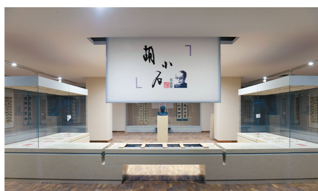
艺术馆“胡小石书法展”展厅