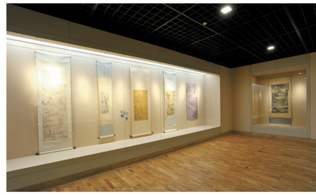
艺术馆“古代绘画展”展厅