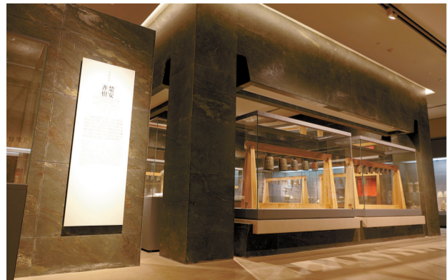
历史馆“吴越春秋”展厅