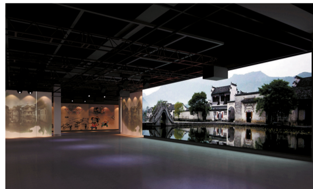
非遗馆“民俗艺苑”展厅