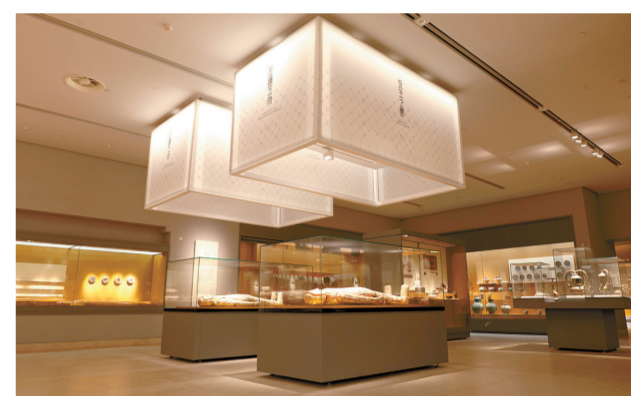
历史馆“汉家故里”展厅

值得一提的是,为方便残疾人参观,彰显人性化服务理念,在馆内一隅辟出专门区域,为残疾人群提供语音解读、手感触摸、助残车等个性化服务,设施先进、创意独特,是国内唯一向特殊人群提供特殊服务的数字体验区。