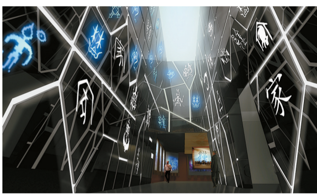
数字馆“开启文明”展厅