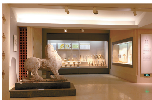
历史馆“六代选兴”展厅