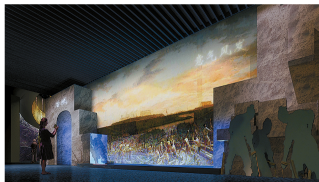
数字馆“意气风发”展厅