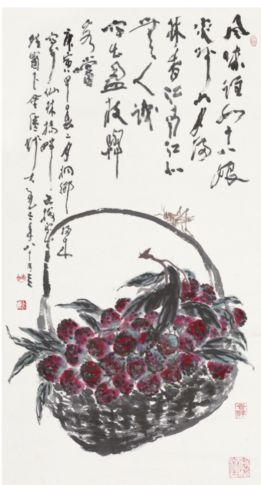
荔枝图(国画) 95×52厘米 钱大礼

钱大礼1927年出生于上海。7岁时父亲病逝，临终前将他托付给胞弟钱瘦铁，由钱瘦铁抚育他成长，从小让他受到翰墨的启蒙与滋养。钱大礼实际上是钱瘦铁的继子，在钱瘦铁的8个子女中，也唯有钱大礼从事书画工作。钱瘦铁与钱大礼之间的血脉之亲、传承之情，是难以用语言来表达的。钱大礼从钱瘦铁那里得到的最大收获，是学会了如何做一位中国人，做一位中国画家，是学到了低调、谦和、从容、勤勉、真