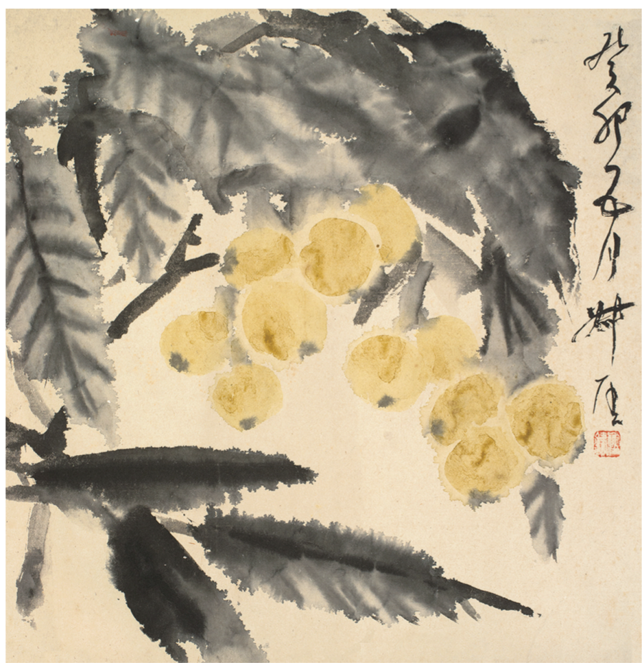
枇杷图(国画) 34.5×33.5厘米 钱瘦铁

表现出来的铮铮风骨。抗战爆发前，他与郭沫若、金祖同正旅居日本，交往密切。三人商定先后回国，共赴国难。郭沫若先行，钱瘦铁为之筹措款项，用“金蝉脱壳”之计帮助郭沫若悄然脱身，自己则被日本警察所执。日本警察对他无礼，钱瘦铁怒不可遏地说：“此不唯侮辱我，实即侮辱整个中国人。”随即手执金属烟灰击日警，被捕入狱，受尽磨难而坚贞不屈。这种风骨，与当年齐白石在抗战期间不为日本人作画，梅兰芳蓄须明志异曲同工。