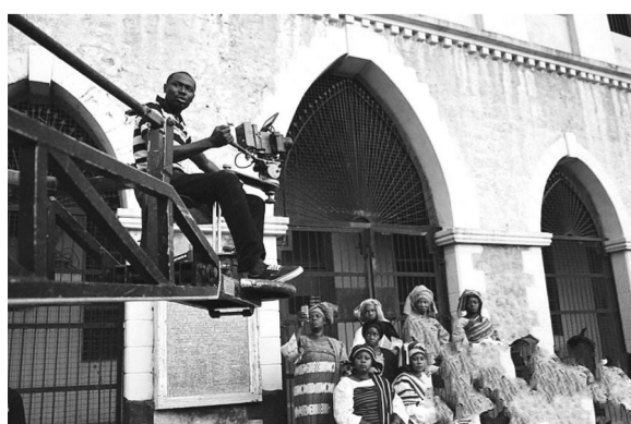
尼日利亚摄影师在拍摄影片

分会场“圆桌沙龙”中,与会中外嘉宾还就“艺术管理与文化遗产”“旅游经济、创意经济与文化产业”两个议题展开思想交锋。(静水)