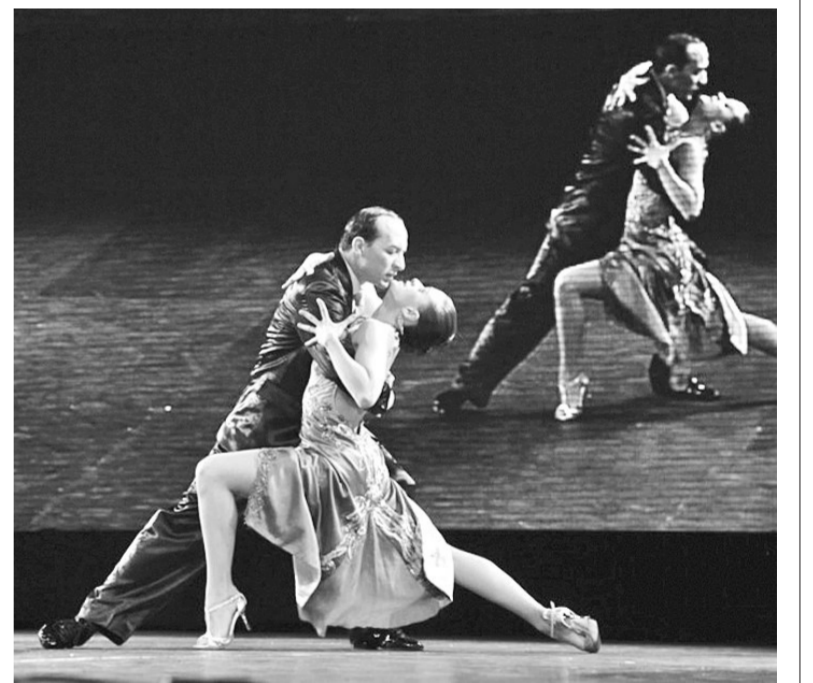
阿根廷世界探戈锦标赛(资料图)

戈的热情,也带动了从业人员水平的不断提高。最近几年,已有来自中国、哥伦比亚、日本、乌拉圭等国的许多外国选手在锦标赛中取得了包括冠军在内的优异成绩,充分表明了探戈在世界范围内的快速发展和普及。通过这些努力,布市政府成功地使探戈这一阿根廷国粹成长为全世界人民共有、共享、共同喜爱的艺术形式。