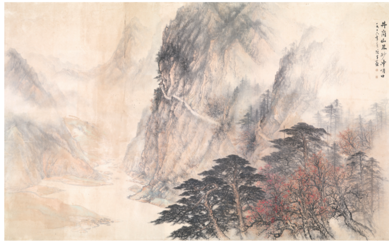
井冈山朱砂冲峭口(国画) 219×372厘米 1976年 黎雄才 广东美术馆藏

分,涵盖了20世纪中国画坛京津画派、海上画派、长安画派、新金陵画派、岭南画派等新时期以来几乎所有的重要流派,汇集了几代国画名家的精品力作。作为20世纪以来中国美术现代化进程的亲历者和承接者,这批艺术家将个人视角与生存在现实的关系转化为艺术主题与时代语境的关系,展现了特有的时代敏感度,使艺术作品对应新的时代特征,并针对不同时期社会形象及意义追寻的不同面向,从社会生活、思想文化等角度全方位反映了人民生活和精神面貌的发展历程。(施晓琴)