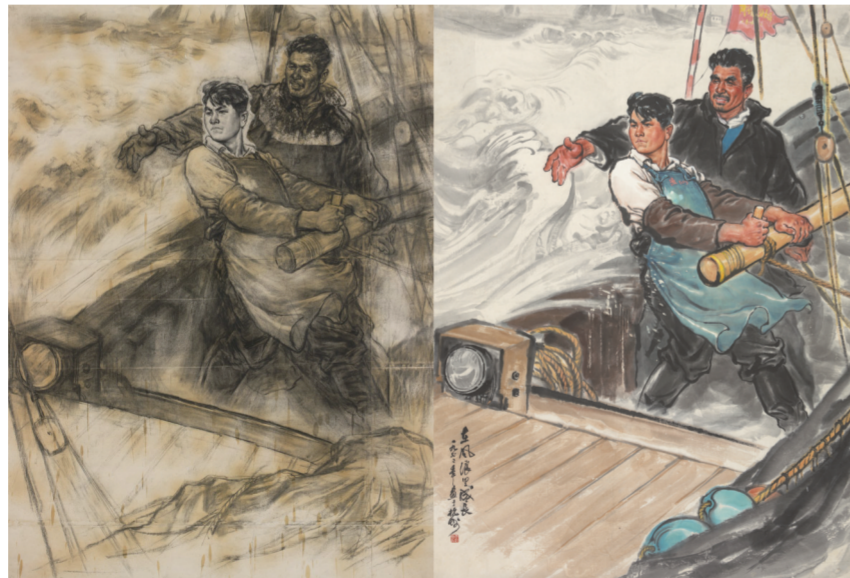
在风浪里成长(素描、国画) 1972年 李震坚

历程和写生、创作作品的情况以及其作品与时代和浙派人物画的关系,将展览分为4个板块。第一板块为“浙派人物开山祖”,介绍浙派人物画的产生背景;第二板块“大笔如椽绘巨作”,将李震坚的主要创作和对应的写生作品及手稿并列展示;“生活滋养写激情”板块,从3000余件生活速写中甄选出最为精彩和具有代表性的60件作品分类展示;“水墨人体新天地”板块,展示了李震坚晚年的水墨人体画和相关素描、速写作品。