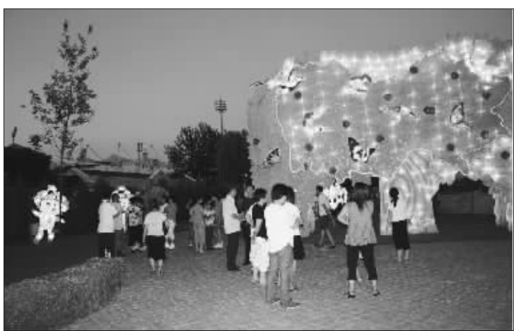
游人在彩灯前流连忘返

房山区“扮靓房山、点亮奥运”奥运文化广场大型艺术灯展于6月23日至9月18日在房