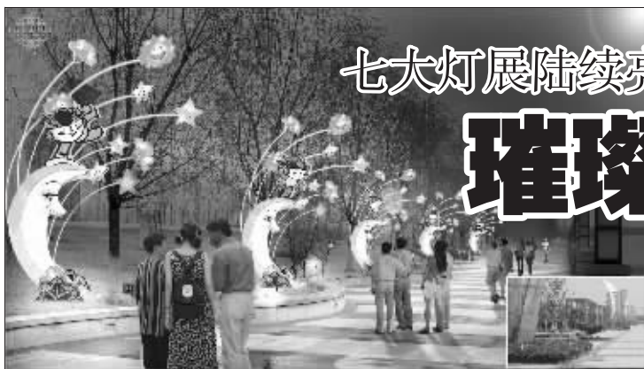
“弯弯的月亮”照亮灯展周边环境

彩灯制作和观赏在我国有着悠久的历史和丰富的文化内涵,这种“光”与“彩”结合的艺术具有独特的使用功能和审美价值,是既延续了传统工艺又展示出现代科技的综合性造型艺术。传统灯彩活动是在正月十五“元宵节”,后来逐步发展成每逢喜事时都张灯结彩,灯彩成了吉祥祥和的载体和象征。北京奥运对于全中国人来说都是一个盛典,奥运会期间,由北京市相关部门组织的7个主题灯展以及由普通市民制作的风格各异的彩灯争奇斗艳,点亮北京,为奥运会营造了欢乐祥和的文化氛围,也让中外游客通过中国传统的灯彩感受博大精深的中国文化。