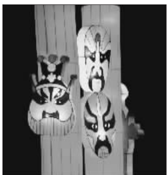
“脸谱灯”体现中国特色

山区府前文化广场举办。灯展分为四大篇章,第一篇章即奥运篇,这一主板块以具有较强时代气息的设计风格,并融汇形、色、声、光、动等表现手法,凸现“同一个世界、同一个梦想”的主题。这一篇章内设计有撷取奥运主场馆“鸟巢”的局部结构设计而成的灯组《炫动北京》,以光雕造型的灯组《相约2008》和《奥运光雕》体现了动感风格,《奥运之光》、《喜迎奥运》等灯组则汇聚了多种中国传统元素符号,紧紧围绕奥运题材,以多种角度、材质和表现手法,展现房山人民迎奥运的喜悦心情和欢庆场面。在具体灯组的设计上他们也下足了功夫,比如围绕奥运五环进行设计,沙燕迎宾门灯组主要造型是几只展翅飞翔的燕子,其造型创意来自北京传统的沙燕风筝,代表奥林匹克五环中绿色的一环;熊猫乐园灯组主要造型是几只憨态可掬的大熊猫,象征着人与自然的和谐共存,代表奥林匹克五环中黑色的一环;鱼庆奥运灯组主要造型是鱼,鱼温柔纯洁,是水上运动的高手,和奥林匹克五环中的蓝环相互辉映。