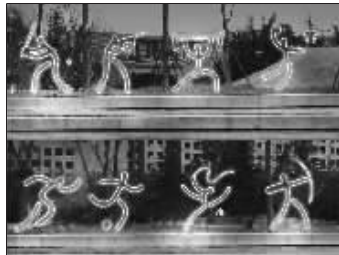
“运动灯”充分体现奥运主题

彩灯制作和观赏在我国有着悠久的历史和丰富的文化内涵,这种“光”与“彩”结合的艺术具有独特的使用功能和审美价值,是既延续了传统工艺又展示出现代科技的综合性造型艺术。传统灯彩活动是在正月十五“元宵节”,后来逐步发展成每逢喜事时都张灯结彩,灯彩成了吉祥祥和的载体和象征。北京奥运对于全中国人来说都是一个盛典,奥运会期间,由北京市相关部门组织的7个主题灯展以及由普通市民制作的风格各异的彩灯争奇斗艳,点亮北京,为奥运会营造了欢乐祥和的文化氛围,也让中外游客通过中国传统的灯彩感受博大精深的中国文化。