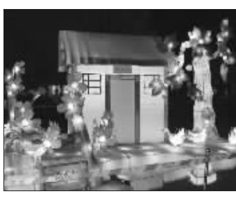
“农家乐”反映京郊特色

月13日正式开展的东城区地坛八区奥运文化广场的灯展最具特色,它是专门全新设计的,60%以上的灯组是第一次亮相,全园的整体感觉就像进入了一个精致的老北京四合院。灯展以东城区的皇城文化、民俗文化、奥运文化为主题,以中国红为主要色彩,以波浪鼓、宫灯、京剧人物脸谱和“鸟巢”为基本设计元素。而崇文区的龙潭灯会则以龙文化为主题,共有大小60组彩灯遍布公园,包括《龙腾奥运》、《海之韵》、《四海龙王》等大型彩灯。