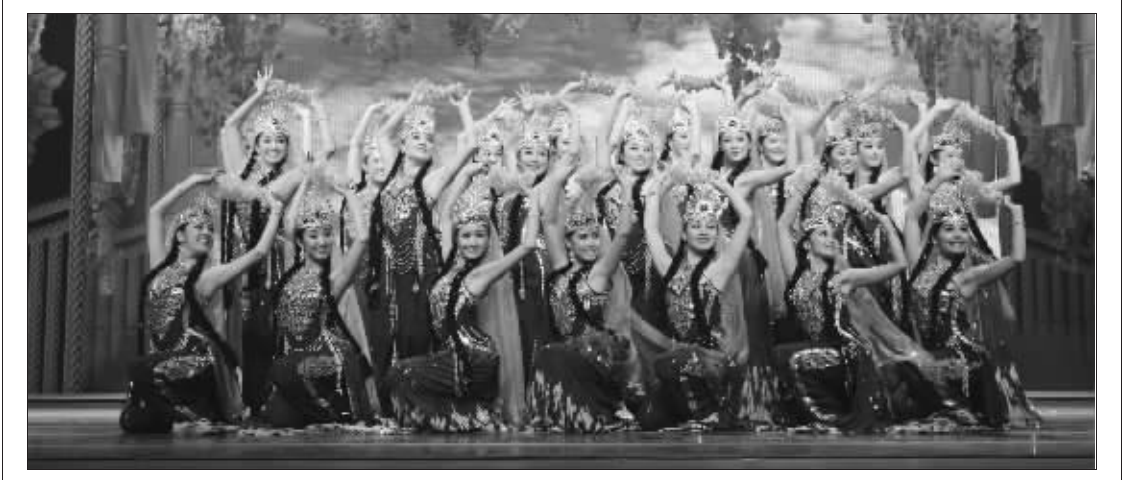
演出时间:8月11日至13日 演出地点:北京国安剧场