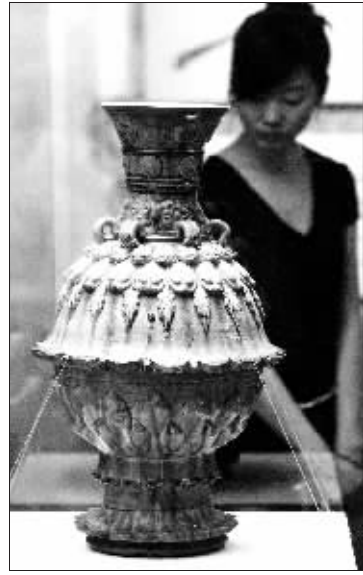
青釉莲花尊(科技馆展)

同时,“世界瑰宝——中华人民共和国国际礼品展”于8月7日拉开帷幕。展览汇集了中华人民共和国成立以来我国党和国家领导人在外交活动中接受的300余件珍贵礼品,内容涉及五大洲的100多个国家和地区,包括金银器、铜雕器、陶瓷器、玻璃器、漆器、玉石器、牙骨器、竹木雕、织绣、绘画等十几个门类。比如,1972年美国尼克松总统送给中共中央主席毛泽东的“瓷塑天鹅”;1978年泰国总理萨纳功送我国国务院副总理邓小平的“柚木雕大象运木”;2001年俄罗斯总统叶利钦赠送我国国家主席江泽民“青花瓷壶”;2006年多哥总统福雷赠送我国国家主席胡锦涛的“木雕手握手象牙形台灯”……这些珍贵礼品,集中反映了新中国成立以来我国的外交成就、国际友好往来和不同国家、地区的文化艺术特色。