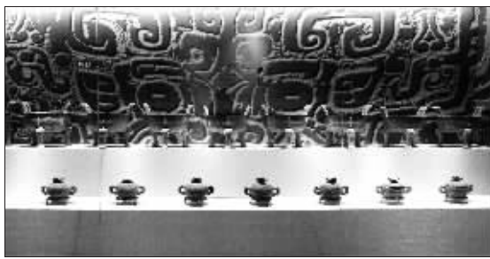
九鼎八簋(科技馆展)