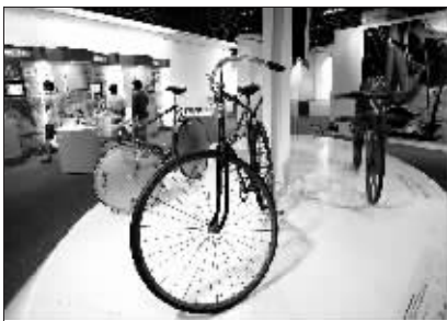
自行车运动的变化(世纪坛展)