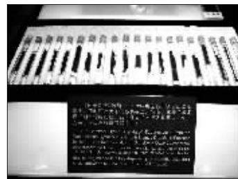
《孙子兵法》竹简(军博展)