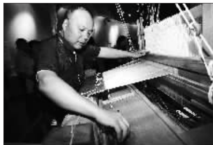
现场展示大花楼采锭提花机的使用(科技馆展)