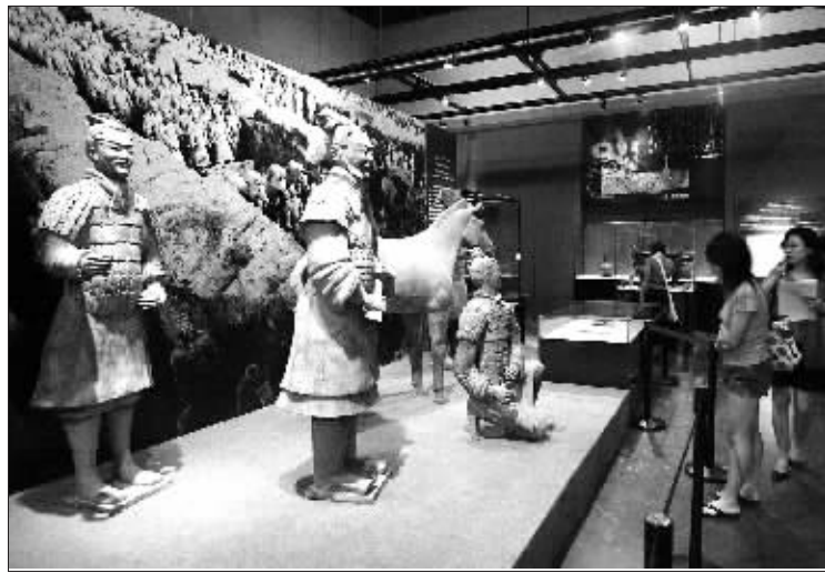
秦始皇兵马俑(首博展)

这次奥博会汇集了奥林匹克集邮、钱币、徽章、艺术品等多种收藏形式,分为展览、展销、文化活动三部分。展览内容包括国际奥委会藏品展(包括萨马兰奇邮集、钱币展)、中国邮票博物馆世界奥林匹克邮票专题展、中国钱币博物馆奥林匹克专题展、国际集邮家奥林匹克专题集邮展、国际奥林匹克纪念品收藏展、国际奥林匹克艺术品收藏展。