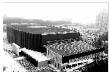
北京科技大学体育馆