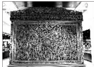
花梨木雕“五环搏击图”(珍品博物馆展)