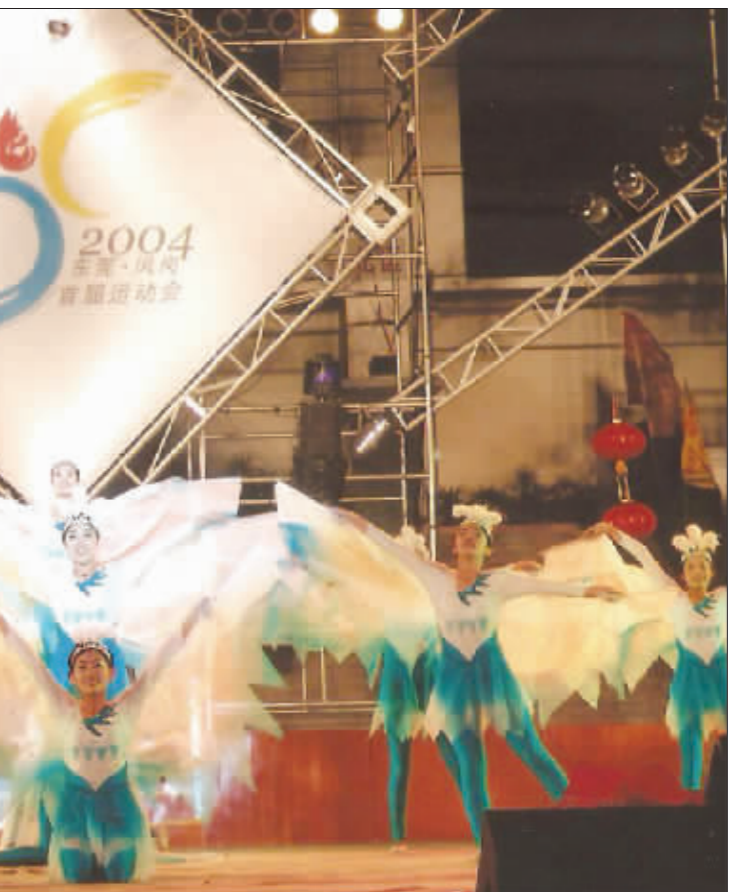
2004年东莞凤岗首届运动会

如火如荼的广场文化,不但丰富了凤岗群众的文化生活,也进一步推动了群众文化社团的蓬勃发展,并创作出具有时代特色的文化精品。