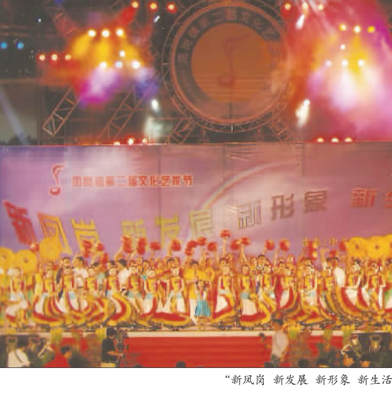
“新凤岗 新发展 新形象 新生活”