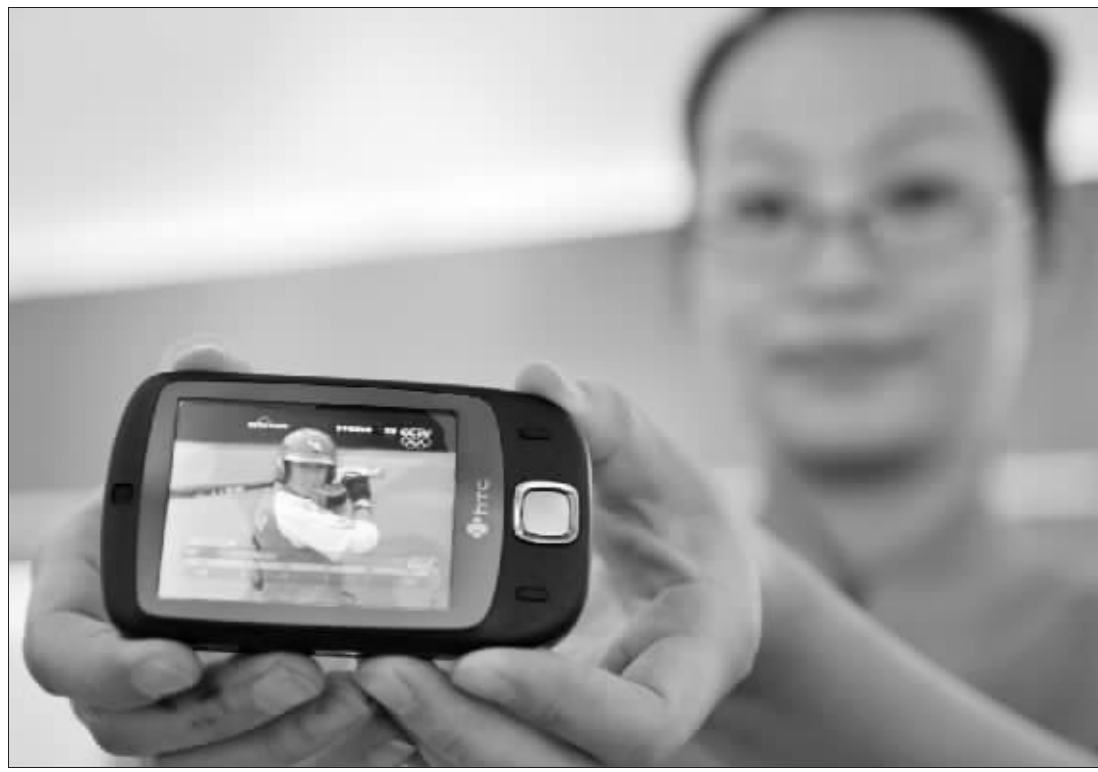
截至8月19日,已有超过100万人通过中国移动网络用手机欣赏精彩奥运视频,节目点击次数近700万,累计播放时长达到30余万小时。图为中国移动的一名工作人员展示奥运手机电视节目。

从6月底开始,随着奥运脚步的临近,《筑梦2008》、《郎朗的歌——献给2008》、《买买提的2008》和《滑向未来》等一批与奥运主题相关的体育题材影片,借各大院线举办的“迎奥运体育题材”影展上市。