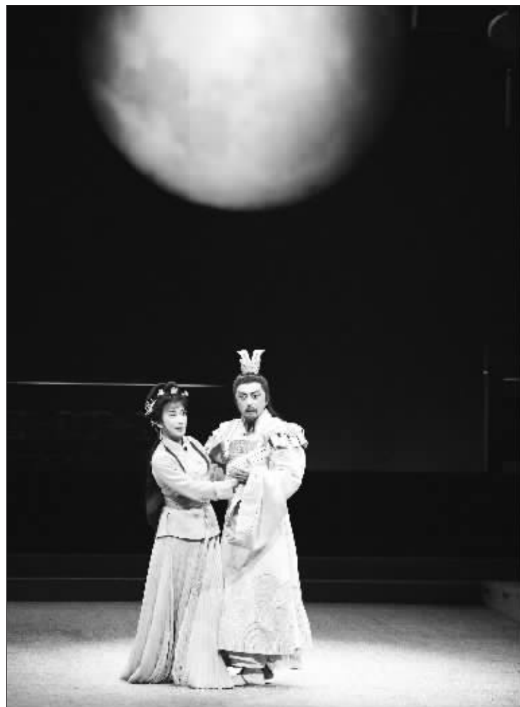
济南市新编京剧《辛弃疾》演出剧照。