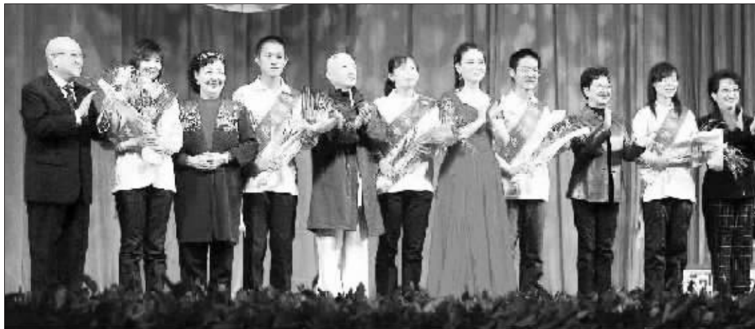
著名表演艺术家尚长荣、李维康、孙毓敏、王玉珍、朱世慧等在闭幕式上向为本届中国京剧艺术节无私奉献的济南青年志愿者代表献花。