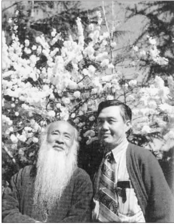
张大千(左)与侯北人(右)