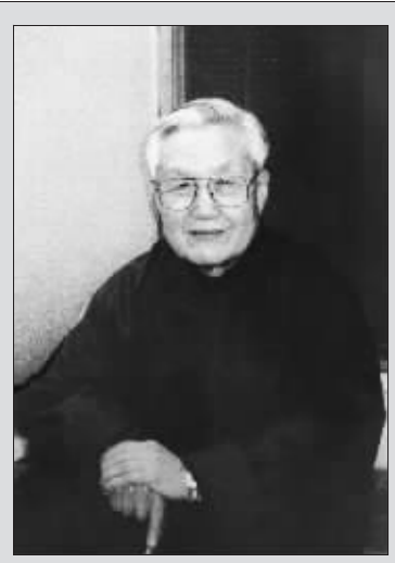
侯北人 原籍河北省昌黎县,1917年生于辽宁省海城,毕业于日本九州帝国大学。早年随河北省李仲庆先生习画,后曾师教于黄宾虹先生及海上郑正桥先生,1956年由香港移居美国加州。侯北人从事中国画创作70年,精研传统,学通东西,其绘画开一代新风。作品多次在国内展出并被多个机构和私人收藏。2004年,江苏省昆山市人民政府建立“侯北人美术馆”。