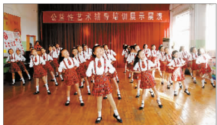
新市民新课堂公益性艺术辅导培训展示展演

据悉,由济南市文化局、济南市群众艺术馆推出的公益性文化培训普及活动,“新市民 新课堂”以外来务工人员及弱势群体为主体,自2007年一经推出,就以其完全公益性受到市民的欢迎。公益性辅导涵盖声乐、舞蹈、表演、器乐、美术、书画、化妆七大类12个小类,共开设各类培训班近80个,参加培训市民达1600人。(济文)