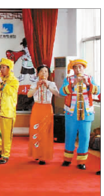
泉城首届“社区春晚”开始选拔节目