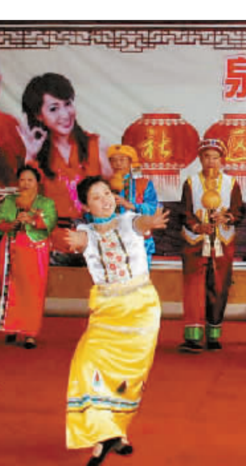
泉城首届“社区春晚”开始选拔节目

一是发挥济南市图书馆试点带动作用,按照“增加投入,转换机制,增强活力,改善服务”的要求,继续深化和完善公益性文化单位的改革创新。二是按照“创新体制,转换机制,面向市场,增强活力”的要求,推进影剧院深化改革和齐鲁园林古建筑公司的改制,并按照上级统一部署,搞好电影机构整体划转的相关准备工作。在继续做好济南市文物店库存文物清库建档工作的同时,积极探索体制改革,确保