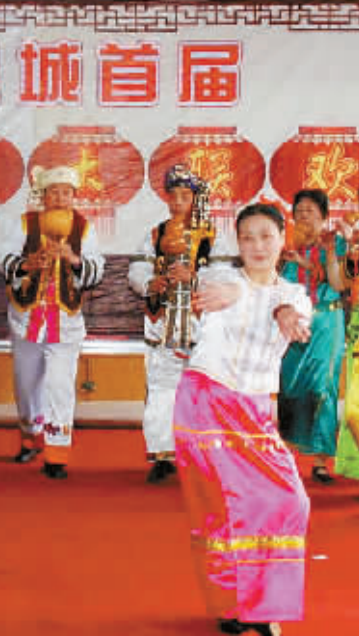
泉城首届“社区春晚”开始选拔节目