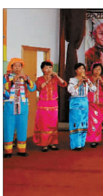
泉城首届“社区春晚”开始选拔节目

一是落实《济南市文物保护规定》,依法开展不可移动文物保护单位管理工作。积极配合棚户区改造、泉城特色标志区建设等重大工程,做好地上文物调查、保护及地下文物的抢救发掘工作。按照全国第三次文物普查工作统一部署,积极推进野外文物普查工作,加强对野外文物普查的指导与监督,争取年底按计划完成野外调查工作。二是继