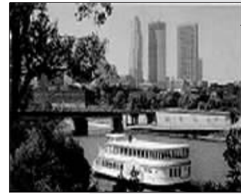
明尼阿波利斯一景

近日,由美国学者评选出的2008“美国十大最有文化城市”榜单新鲜出炉。上年度上榜的“十大城市”其实有11个,分别是明尼阿波利斯、西雅图、华盛顿特区、圣保罗、旧金山、亚特兰大、丹佛、波士顿、圣路易斯、辛辛那提和波特兰。其中辛辛那提和波特兰并列第10位。明尼阿波利斯和西雅图两个城市连续多年占据这个排行榜的前两位,在众多城市中文化水平最高。此外,华盛顿特区、亚特兰大也是榜单上的“常客”。但纽约、芝加哥、洛杉矶等大城市却多年榜上无名。