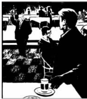
法国连环画《悲惨的星期日》

金融危机对一些实体经济行业的影响在不断显现,但法国连环画评论联合会日前说,法国连环画行业幸运地在金融危机中“怡然自得”。