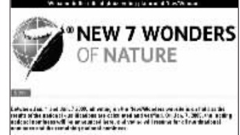
“新七大奇迹”基金会网站

不久前,瑞士一家民间组织“新七大奇迹”基金会宣布将推出“世界七大自然奇观”的网络投票活动,预计在2011年的某个时候揭晓名单。