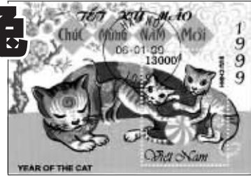
越南发行的猫年邮票

由于历史上深受中国文化的影响,中国周边国家如日本、韩国、越南、蒙古等民间也习惯使用农历,而且有着与中国十分相似的生肖文化。日、韩、蒙古的十二生肖与中国是完全一样的,但越南却有一点小小的不同。在越南人的十二生肖中没有兔子属相,取而代之的是猫。因此,中国的“兔年”在越南成了“猫年”,在中国属“兔”的人,到了越南就变成属“猫”了。为什么中国的“兔”到了越南