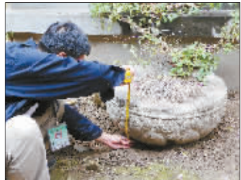
文物普查队员在工作

是我们的职业习惯。”过会儿,他手里拿着一块刚捡到的陶片,高声喊叫普查小队的队员们:“就在这里的香炉,普查队员们照样对它进行详细的测量、记录。再回到寺庙大门口,人们再一次仔细观察平铺在地上当台阶用的一块大平石,刚开始的时候大家就觉得这像是一块石碑,这会儿有人拿来刷子和清水,清除石头上的泥土后,果然看见上面的刻字。寺庙住持来说,过几天她准备把这块石碑搬起来,立在大门口边上。有在庙里干活儿的妇女出来,住持说:“你们注意,进出口门尽量走两边,不要踩中间 到了该收工的时候,预定对石佛寺遗址的考察就没有时间了,但侯队长说,虽然是意外收获,但这处古代遗址的价值其实更大。这就是为什么文物普查要采取地毯式搜索的方式,因为许多真正有价值的东西农民可能并不了解,除了和老人们座谈之外,更重要的还是要靠队员们的眼睛和双腿。 有了这个沉甸甸的收获,我们才有了感觉,觉得确实是走在有几千年历史的长安的土地上了。