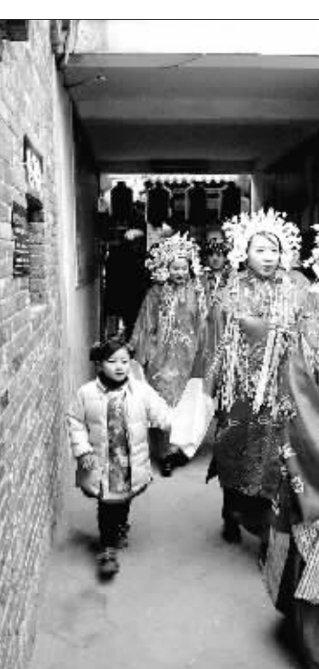
1月11日，“爱在齐鲁 情定古城——2009山东传统民俗婚礼”庆典在淄博市的周村古商城举办。来自济南、东营、青岛等地的20对新人身着传统婚服，体验民俗风情。图为身穿民俗服装的新郎和新娘。

2003年11月26日，一群西装笔挺的客人在上海陕西北路靠近南京西路的地方，举行了一个隆重的典礼——在大门的墙上挂出了一块牌子，银底红字，十分庄严，这里举行的是荣宗敬故居的挂牌仪式。原来此地就是现代