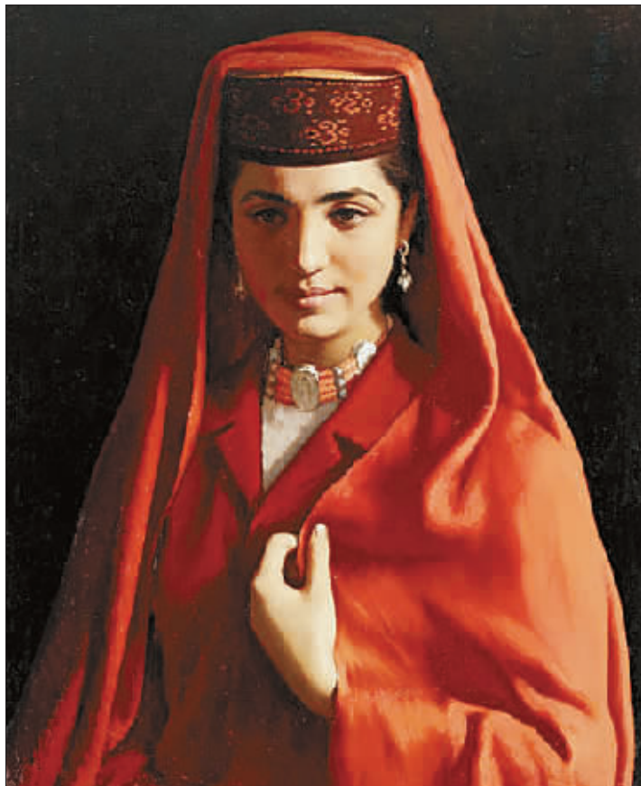
塔吉克新娘(油画)1983年 靳尚谊