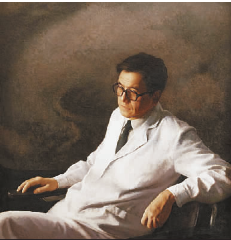
医生(油画)1987年 靳尚谊