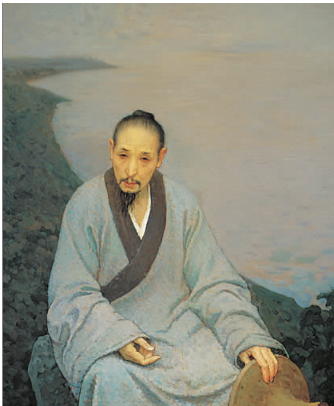
八大山人(油画)2006年 靳尚谊