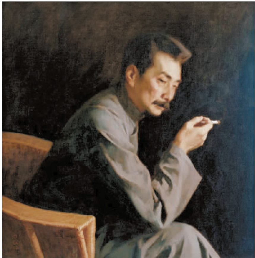
鲁迅(油画)1981年 靳尚谊