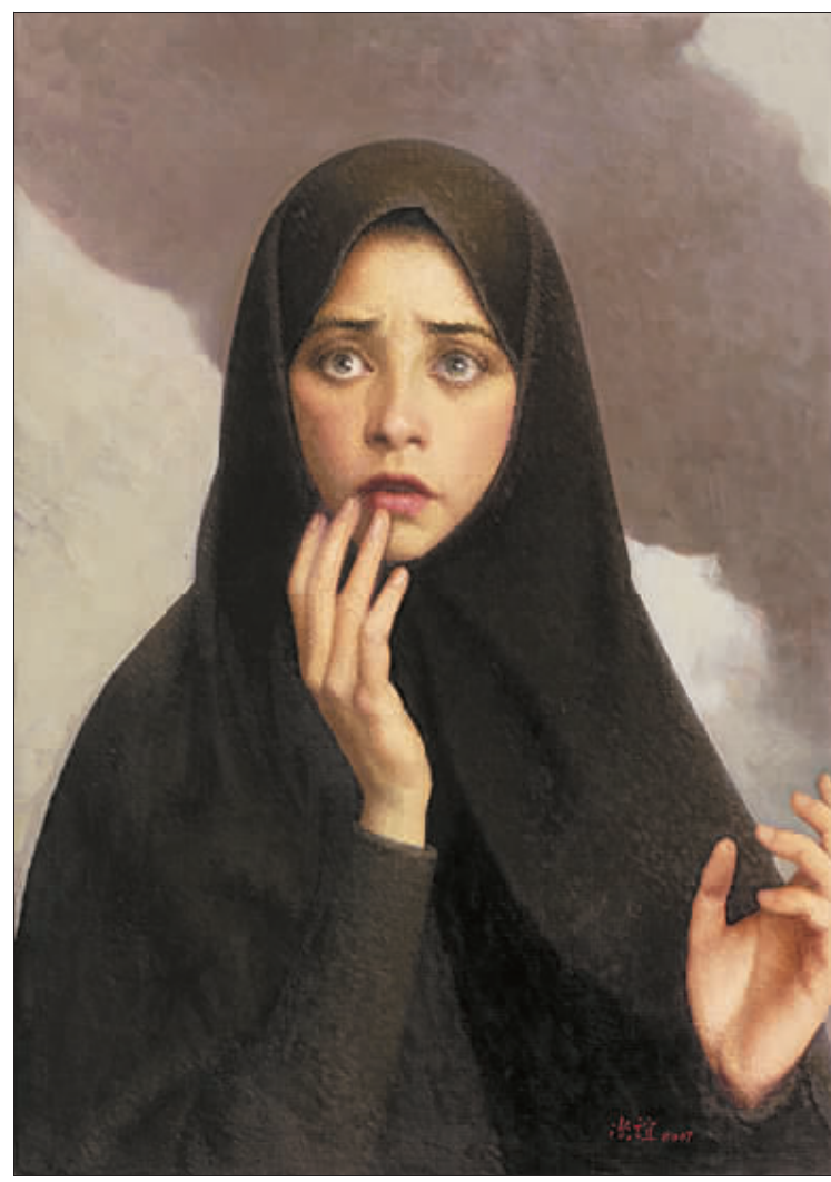
惊恐的妇女(油画)2007年 靳尚谊