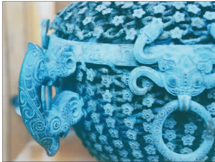
铜陵作为中国古铜都,其冶炼、铸造青铜的历史始于商周、盛于唐宋,一直绵延至今。在铜工业高度自动化的今天,铜的采冶技术、铸造技术进步显著。“春秋鉴”雕塑作为安徽省人民政府向北京奥运会赠送的礼品,2008年被安放于北京奥体中心民族大道。

但作为中国传统文化的重要组成部分,铜文化面临着如何继承和发展传统精髓的问题。如何于传统之外,赋予其当代的审美情怀?当代艺术与传统交融,是一个既老且新的话题。铜陵以其城市雕塑、高仿青铜器、铜工艺品、现代铜材料装置等图片、实物与作品,试图详说铜文化的独特艺术魅力。(露 露)