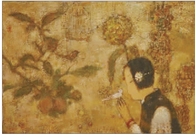
山艺术此次展出的是收藏多年的倾心之作,共有多位优秀艺术家不同风格的艺术作品近30幅。当然,这只是山艺术藏品中的一部分。图为贾鹏雨作品《对话》。(丁 虹)