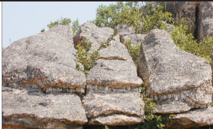
艾山奇石景观之一鳄鱼石

参加本届音乐周的乐队,大多是国际知名的、具有鲜明地域特色和民族风情的乡村音乐团队。其中有曾为南非前总统曼德拉、美国前总统小布什现场表演的南非鼓咖咖啡乐团;有希腊民谣推广之母玛丽莎女士带领的乐队;有澳大利亚民谣之父格兰特·路荷斯的小分队;有擅长柔情风格的美国露西天使乐团;有致力于传承和保护安达卢西亚文化的摩洛哥民间音乐团队;还有来自云南、新疆、内蒙古、贵州、陕西和湖南本土的侗、苗、瑶音乐团队也都是颇具民族代表性的音乐劲旅。