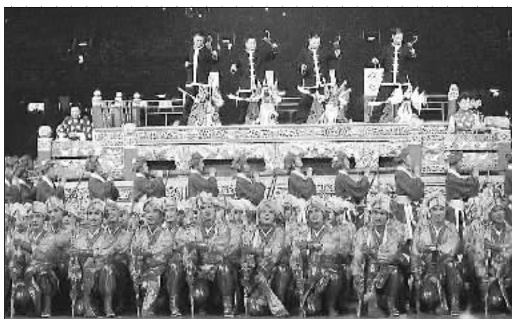
泉州提线木偶戏在北京第29届奥运会开幕式上表演

2002年经中国艺术研究院推荐,泉州提线木偶戏同昆曲等10个项目,被联合国亚太文化中心列入“传统民间表演艺术数据库”。 2005年应邀赴美国纽约联合国总部参加“2005联合国中国春节文艺晚会”专场演出。 2005年10月,泉州市木偶剧团被人事部、文化部授予“全国文化工作先进集体”称号。 2005年被授予“联合国南南合作网·木偶艺术示范基地”。 2006年泉州提线木偶戏入选首批“中国非物质文化遗产保护名录”。 2007年6月获文化部“文化遗产日”奖。 2007年赴巴黎联合国教科文组织总部参加“联合国中国非物质文化遗产艺术节”,在最高国际交流与合作平台上,以精湛的技艺和精彩演出,展现中国傀儡戏的迷人风采,赢得广泛的国际声誉。 2008年8月8日,泉州市木偶剧团参加了在北京举行的第29届奥运会开幕式的演出,向全球40多亿电视观众展示了中国提线木偶戏的独特风采。