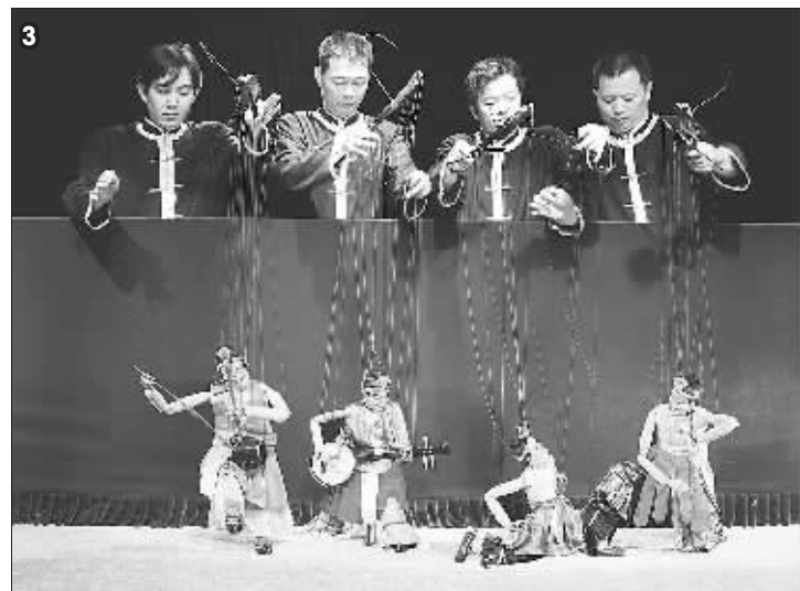
1.《钦差大臣》剧照 2.《火焰山》剧照 3.《元宵乐》剧照 4.泉州市木偶剧团在纽约联合国总部演出