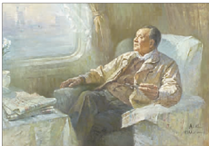
小平南巡(油画) 陈继武 183cm×258cm 2003年

满了对未来希望的渴望,坚定了革命战争必胜的信心,战士们面对艰苦的生活,没有被困难压倒,而是苦中作乐,充满了幻想和对美好事物的回忆,作品极具诗意性。