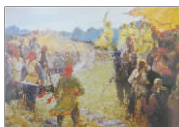
金田起义(油画) 王旭珠 199cm×280cm 1961年

这幅画在空间处理上融合了高远和深远两种方法,通过独特的构成方式,表现了毛主席的革命胸怀和英雄气概。画面的远景是高山,山体巍峨雄壮,用了纪念碑式的构图方法,再加上笔墨十分厚重,给人以崇高伟大的感受,很好衬托出了毛主席雄才远略、气吞山河的伟人形象。近景山体上竖立的墨线压住厚重的色调,显示出直冲云霄的势头,而这种势头又被长短不一的横线多层次地截断,遏制了上冲的感觉。这样一来,在山体中就积聚了一股沉厚的待发之力,而位于中心位置的毛主席侧立像则是一条未被截断的竖线,所有蓄积于山体中的上冲力在这里得到了爆发,人物所占空间虽小,却有天地一人、统领山河之气势。人物