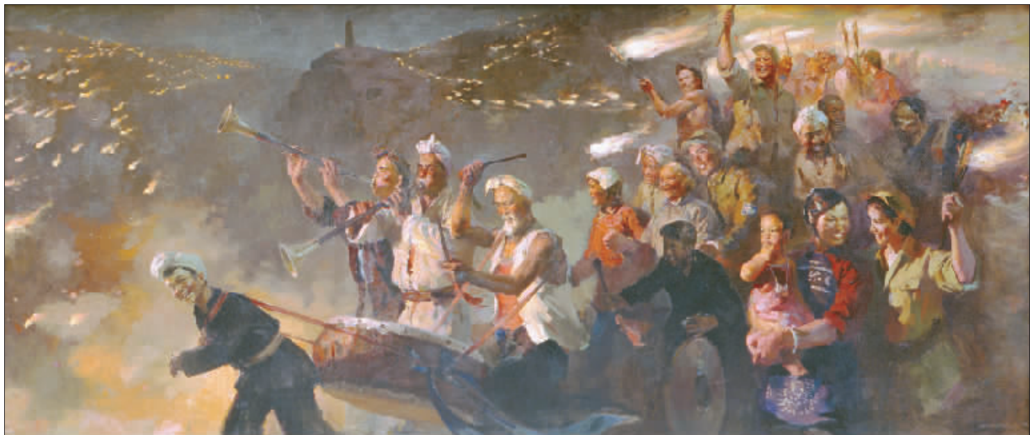
延安火炬(油画) 蔡亮 164cm×382cm 1959年

《小平南巡》为本次展览中唯一一件反映了社会主义改革开放的画作。作者陈继武为福建福州人。画面中,小平同志坐在南下的列车上,两眼深情地望着窗外一片生机勃勃的大地。此时,正值中国改革开放的探索期,中国的发展应该何去何从,小平同志一直在思索。南巡讲话给中国的市场经济注入了活力。小平同志强调,改革开放胆子要大一些,要敢于试验,看准了的,就大胆地试,大胆地闯。他说,没有一点闯的精神,没有一点“冒”的精神,没有一股气,就走不出一条好路,一条新路,就干不出新事业。改革开放迈不开步子,不敢闯,说到底就是怕资本主义的东西多了,走了资本主义道路。要害是姓“资”还是姓“社”的问题。判断的标准,在于是否有利于发展社会主义的生产力,是否有利于增强社会主义国家的综合国力,是否有利于提高人民的生活水平。对于这些疑问,小平同志在南巡之前,就已经有了成熟的思考,画面中,小平同志安详地坐在列车上,眼望窗外,阳光映在小平同志的脸上,一切都显得安详平静,但身后却是风起云涌。另一方面,作者在画面中也深深地表达了对一代伟人的无比崇敬和怀念之情。