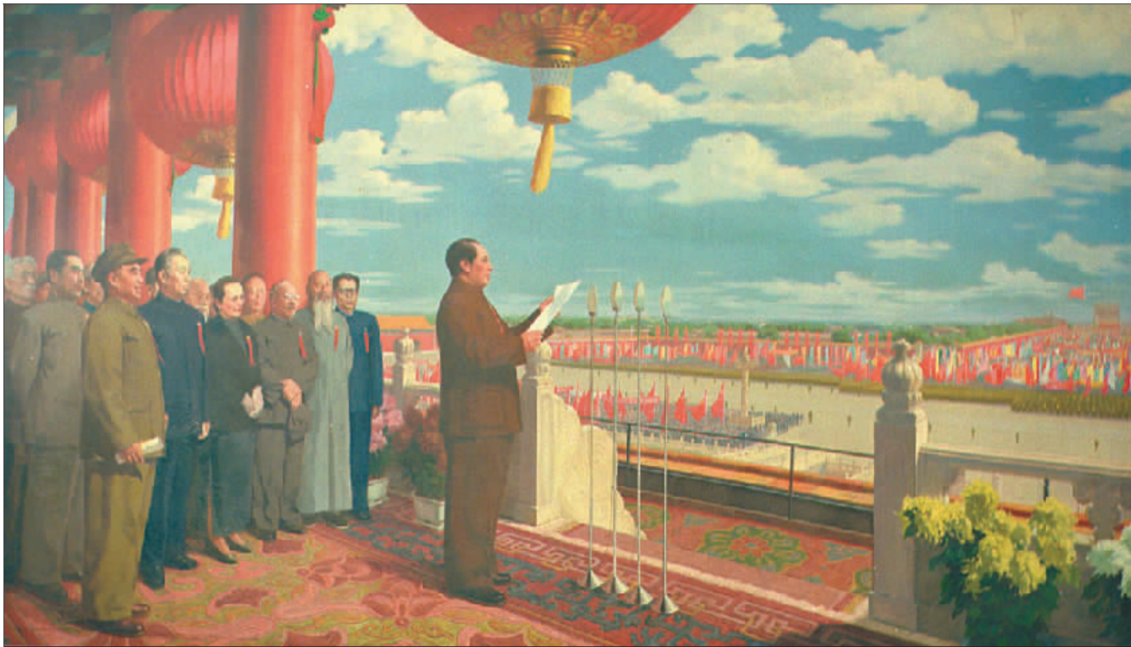
开国大典(油画) 董希文 230cm×402cm 1953年