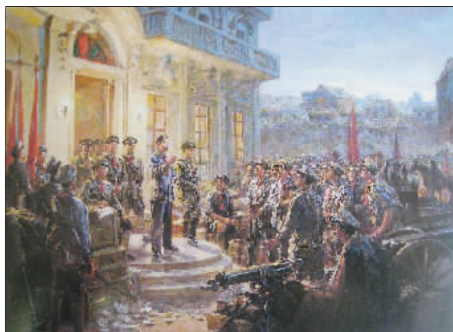
南昌起义(油画) 黎冰鸿 200cm×260cm 1959年