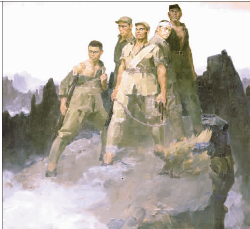
狼牙山五壮士(油画) 詹建俊 1959年