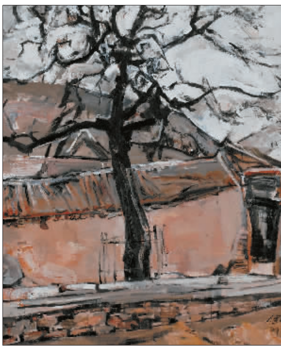
拴马槐的故事(油画) 刘健强