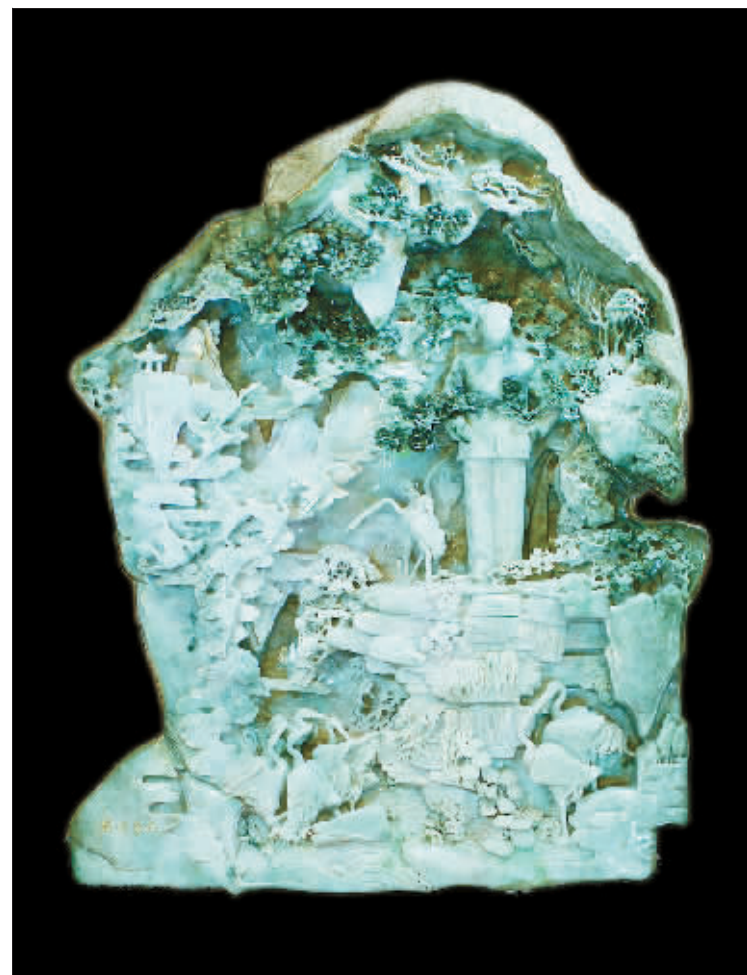
重上井冈山(雕塑) 梁晓年