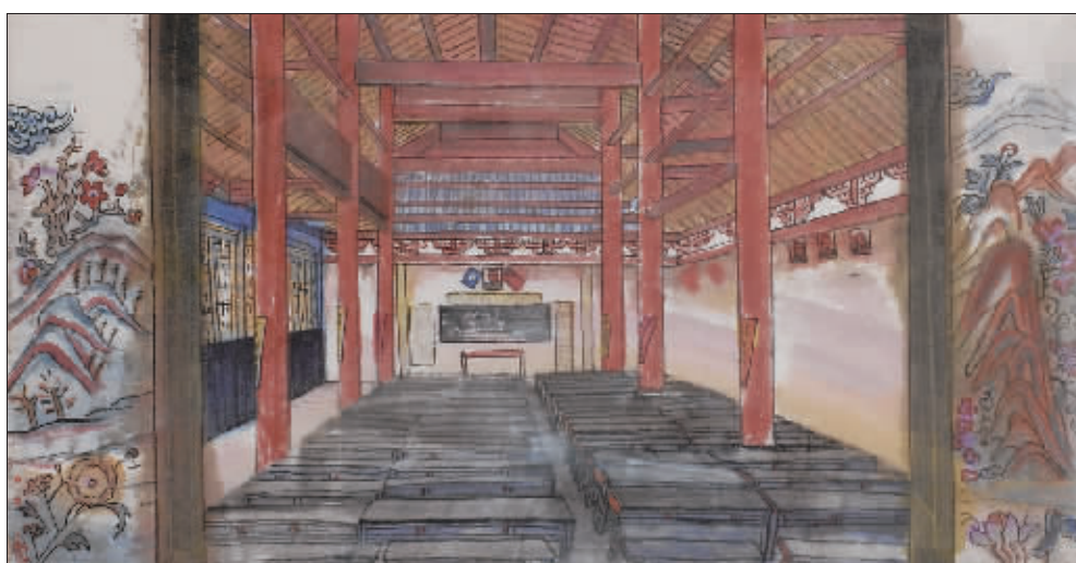
广州农民运动讲习所(水墨) 颜新元