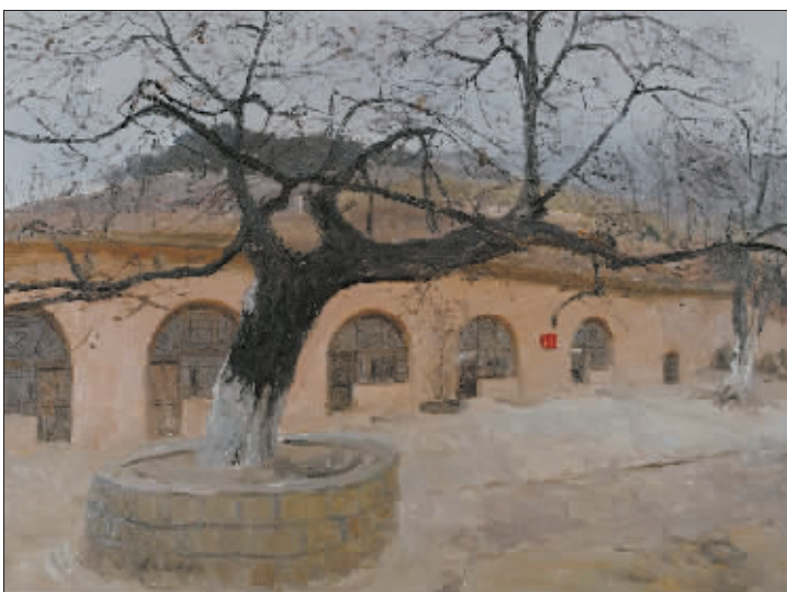
枣园毛泽东旧居(油画) 马建飞