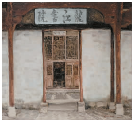
龙江书院(油画) 杨尧