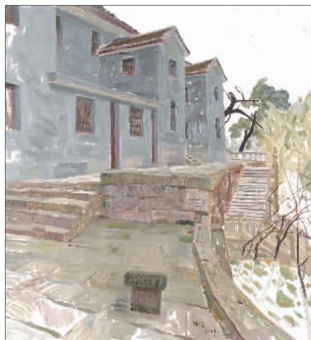
红岩村的石阶(油画) 谢森