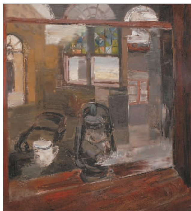
窗下无声的见证(油画) 张文志