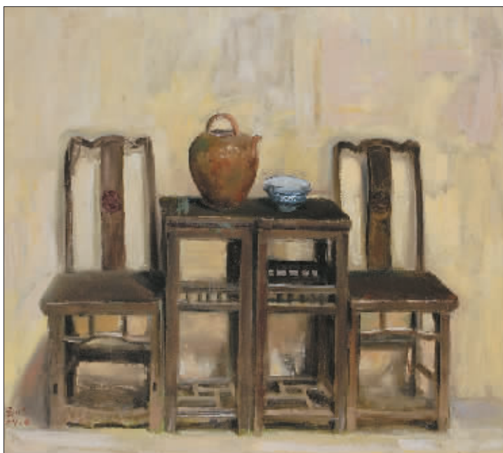
八角楼毛泽东旧居内景(油画) 孙浩