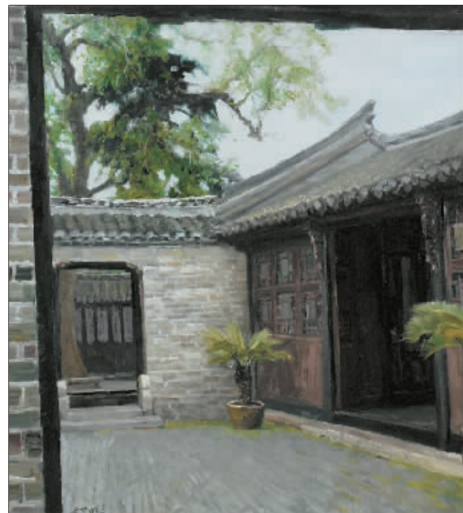
周恩来诞生之地(油画) 曲湘建