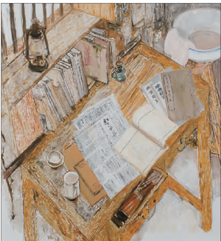
瑞金叶坪毛泽东居所书桌(油画) 戴士和