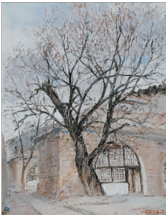
朱德柳(油画) 崔国强