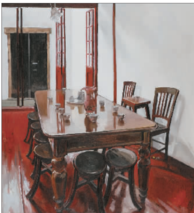
中共“一大”会场内景(油画) 李彦辰