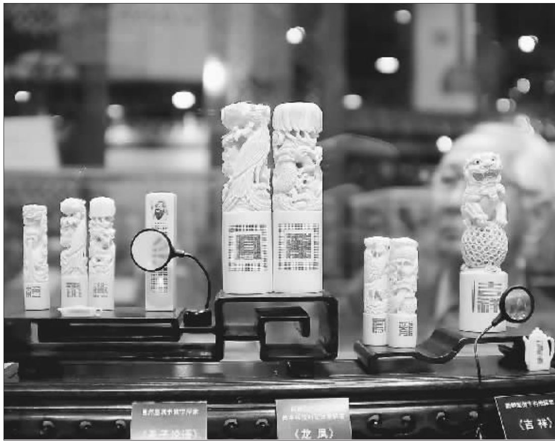
10月29日，第十届中国工艺美术大师作品暨国际艺术精品博览会在杭州和平国际会展中心开幕，共有来自全国各地的400多家工艺美术企业及380多位国家和省市级工艺美术大师参展。（新华社发）

同时，继春拍成功推出明清工艺精品专场后，永乐继续强化专场优势，此次呈现的200余件拍品种类丰富、形制各异，包括田黄石、竹木牙角雕刻、紫砂、织绣及文房用品等，单件估价从几百万到万元不等，为不同藏家提供多种选择机会。（美周）