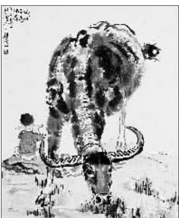
牧童短笛(国画) 徐悲鸿

本报讯（记者高素娜）北京诚轩秋季拍卖会将于11月22日至24日在北京举行，共推出中国书画、瓷器工艺品、油画雕塑及邮品钱币4个项目，共8个专场。其中，邮品钱币项目将于11月13日至16日开槌。