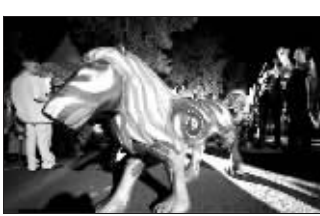
筹得17万美元(约合116万人民币),所得款项将全部用于狮子保护行动。

近日,在首都内罗毕的肯尼亚野生动物保护局,共有49座五彩斑斓的狮子雕塑被拍卖。这些狮子雕塑和实体大小相当,出自于不同的艺术家之手。据肯尼亚野生动物保护局统计,目前肯尼亚只剩下狮子2000只左右,因此“必须尽一切努力维持现在的数量并使其有所增加”。当天的拍卖活动已经