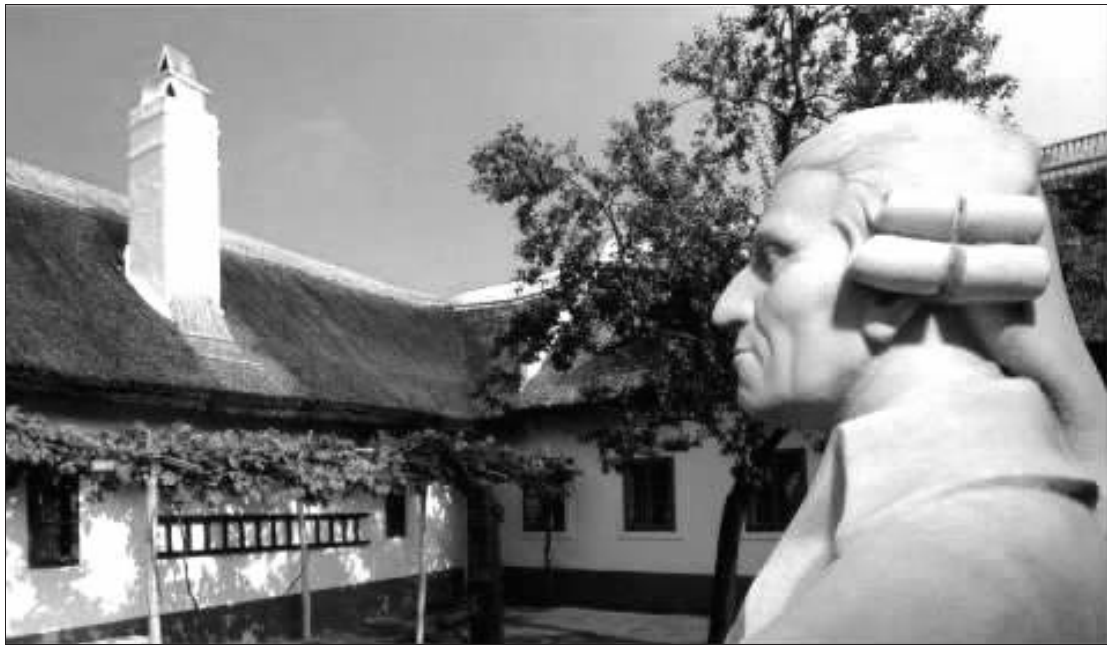
海顿的出生地已成为“海顿年”活动的主打旅游品牌

特。因此,当地政府在向游客们提供音乐会、展览等文化盛宴的同时,自然还要为观光者准备与之相匹配的交通、住宿、餐饮等整套服务设施。除此以外,这里还举办了大量的主题性活动,如海顿周、海顿弥撒、海顿音乐节、国际海顿研讨会以及海顿室内乐作品比赛等。奥地利政府当然也不会忘记将音乐家的出生地、故居、活动场所及周边设施,用作推广本国旅游的一个重要资源,“兜售”给国内外慕名而来的人们。海顿在维也纳的故居被改建成了海顿博物馆,所在街道也已经被命名为海顿街。活动期间,海顿的出生地和墓地,以及他少年时曾经作为成员的维也纳童声合唱团驻地,和成年后的每一个演出场所,都成为了面向游客开放的观光景点。