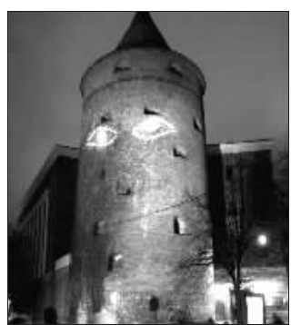
(以上消息来源:新华社等)

11月14日至18日,拉脱维亚举行第二届“闪亮里加”灯光艺术节,庆祝独立日的到来。拉脱维亚于1918年11月18日脱离沙俄而独立。首都里加的历史可追溯至1201年,13至15世纪就已经成为欧洲的交易繁荣区。城中的古老建筑物带有浓厚的中世纪烙印,被认为是欧洲艺术建筑物保留最完整的城市之一。因为里加市的一座被灯光装扮成人像模样的塔楼。