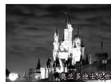
奥兰多迪士尼世界