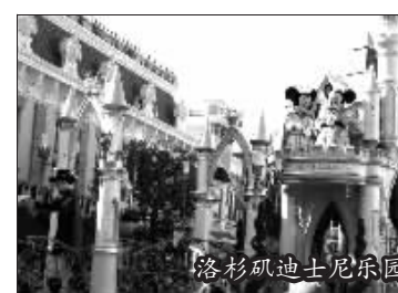
洛杉矶迪士尼乐园