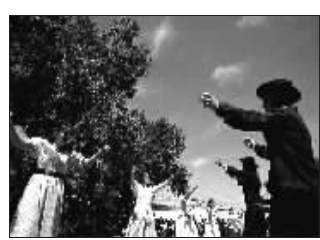
图为民俗节上载歌载舞的高乔青年男女。

11月8日,第70届阿根廷高乔民俗节在布宜诺斯艾利斯省北部的圣安东尼奥·德阿雷科镇举行。高乔人属混血人种,由印第安人和西班牙人长期结合而成,保留了较多印第安文化传统。从1939年开始举办的民俗节展现了高乔人多姿多彩的风俗传统,圣安东尼奥·德阿雷科镇因此也成为了阿根廷的“国家历史小镇”。