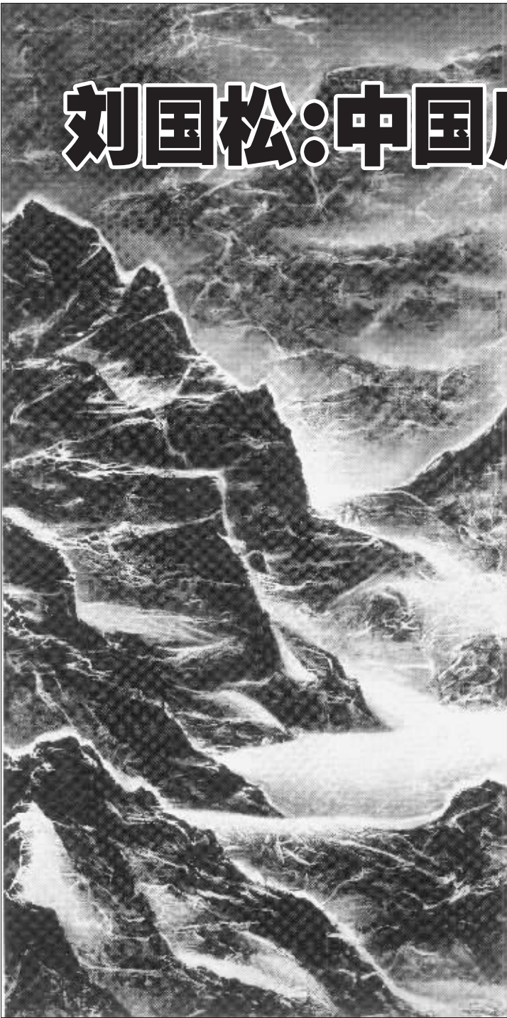
消失中的冰川(水墨)