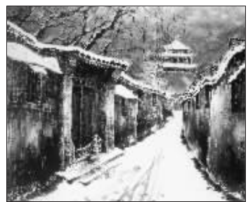
钟楼残雪(国画) 邵辰

本报讯 (记者鲁娜)胡同是京师文化的重要组成部分。1月7日,以书画、摄影展现宣南胡同风情的“玉润仁和”胡同艺术展在北京市宣武区文化馆开幕,吸引了众多市民冒着雪后严寒前来参观。