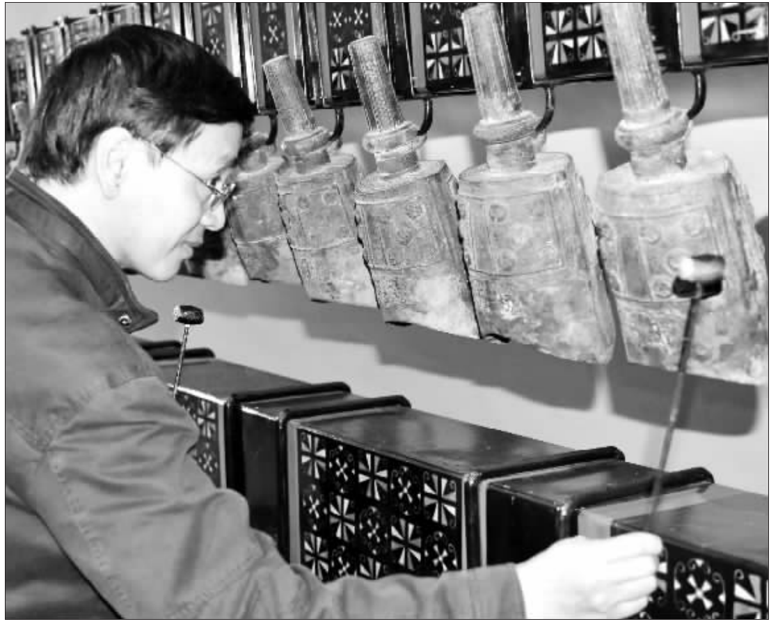
1月25日，中国古代科学技术展在澳门科技馆举行，展出超过100件展品，涵盖天文、火药与武器、造纸、印刷等具有代表性的中国古代科技制品。图为工作人员在中国古代科学技术展上演示编钟演奏。

后被埋葬在了位于法国卢瓦尔河谷的昂布瓦兹城堡内，因此意大利研究小组不得不与法国文化部门的官员以及昂布瓦兹城堡的主人进行了长期的谈判。近日，该研究小组表示，法国方面已原则同意了挖掘计划，具体工作有望在今年6月展开。 研究小组负责人艾文森介绍说，他们需要做的第一件事就是使用碳测定法确定那些遗骨主人的生活年代并提取DNA样本与达·芬奇后代的DNA进行对比，以核实那些遗骨究竟是否是达·芬奇本人的。 艾文森还说：“尽管历史书上没有任何记载，但我们也可以通过研究那些遗骨证实达·芬奇是否死于某种疾病。” 然而这项计划也遭到了部分学者的激烈批评，他们认为有关达·芬奇的某些秘密应该保持下去，而且挖掘达·芬奇遗骨是对这位意大利文艺复兴时期文化巨匠的“大不敬”。（宋河）