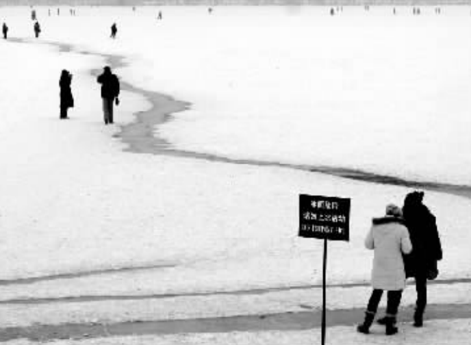
40年不遇的寒冷天气，把湖面冻得结实。眼下，在北京许多公园内，封冻的湖面成为人们嬉戏的场所。在此还是要提醒人们：冰面危险，请勿上冰活动。

工程”奖，所拍摄的电影获得了华表奖、金鸡奖等众多国家级大奖，培养了几代年轻栋梁，并多次赴我国港、澳、台地区以及东南亚、美洲、大洋洲等国家和地区演出，为黑龙江对外文化交流和品牌文化建设做出了突出贡献。在近日举办的第11届中国戏剧节上，龙江剧《鲜儿》获得优秀剧目、优秀导演、优秀表演3个一等奖。