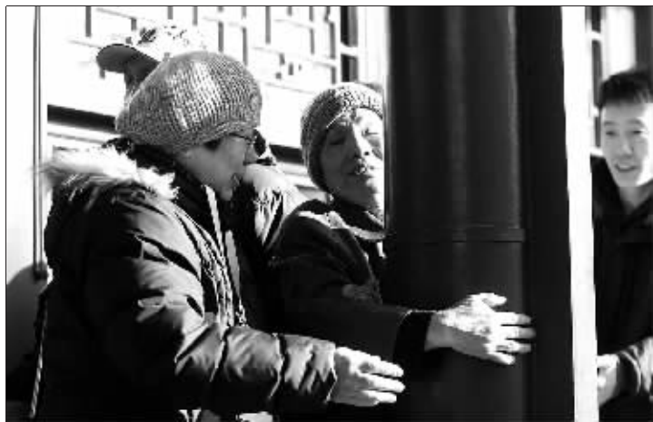
2 月 4 日，北京恭王府迎来了一批特殊的客人。他们是通过北京红丹丹教育文化交流中心“心目影院”组织来参观的盲人朋友。在志愿者的讲解与帮助下，盲人朋友们用双手触摸到了拥有 200 多年历史的大门门钉、石狮子、铜路灯、古树等，真实地感受到恭王府这座王府博物馆的悠久历史与文化气息。

据披露，本次发行前，汉王科技的总股本为 8000 余万股，本次拟发行 2700 万股流通股，于 2 月 9 日开始申报。据统计，2009 年，汉王的销售收入分别为 2.34 亿元和 2.28 亿元，但 2009 年这个数字增长到 5.81 亿元。其中，“电纸书”销售额为 3.9 亿元。在利润上，2008 年比 2007 年增长了 106.2%，2009 年比 2008 年增长了 183%。