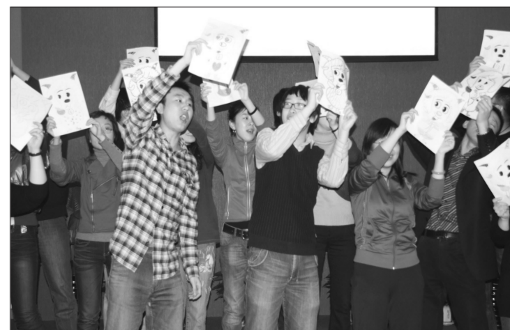
联欢会上,学员们拿着自己画的“喜羊羊”合唱歌曲。

据悉,4月7日至25日,该剧将在上海话剧艺术中心上演。演出期间,大华公益基金管理委员还特意安排3场公益专场,邀请低保家庭及社区居民观看。(尚艺)