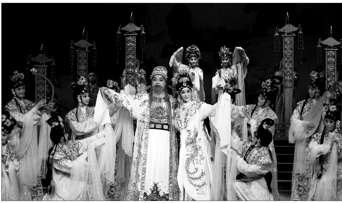
《长生殿·重圆》

长)对这部连台本的昆剧全本《长生殿》演出,人们可以从不同的角度来评说。它就好在重新回归《长生殿》的本来,回归《长恨歌》的原点,是以当代的眼光向《长生殿》原点的靠拢,也是向《长恨歌》原点的靠拢。让我们在观赏演出过程中重新获得《长恨歌》所提供的“天长地久有时尽,此恨绵绵无绝期”的感觉。