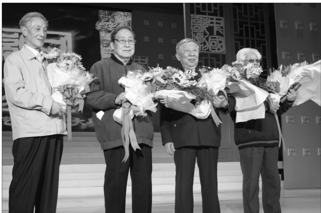
贺敬之、田川、阎肃、任萍被授予“中国歌剧剧作家终身荣誉”