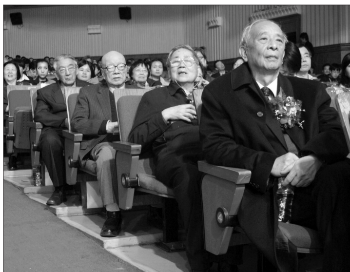
院士、学者坐成一列,先后登台为获奖者颁奖。

北京大学歌剧研究院成立仪式结束后,下午3点,“金葵花中国歌剧艺术成就大典”之“终身成就荣誉”揭晓,19位德高望重的中国歌剧老艺术家荣膺此殊荣。“金葵花中国歌剧艺术成就大典”是北京大学与中国歌剧研究会联合举办的一个学术性庆祝活动,旨在对中国歌剧艺术领域取得突出成就的个人进行表彰和奖励。以后,“金葵花中国歌剧艺术成就大典”将成为北京大学的制度性活动定期举行,奖励和表彰内容涉及“歌剧学”的各个方面。 此次的“终身成就荣誉”是“金葵花中国歌剧艺术成就大典”首次颁发。评审委员会设立了剧作、作曲、导演、表演、声乐教育、