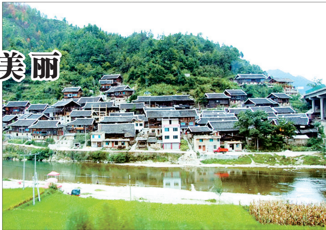
西江千户苗寨的独特风光

如同其他古镇,随着旅游开发,千户苗寨也正在面临一个商业化的过程。街道两边,吊脚楼下,到处都是经营各种小商品的摊点。穿过一道又一道小巷,走过一座又一座吊脚楼,来到了一家“苗家乐”。干净清爽的小木屋飘散着枫木清香,窗外是一栋栋精巧别致的吊脚楼,敞开的窗户飘进来浓郁的苗乡气息。千户苗寨,真是令人看上一眼就难忘的地方。