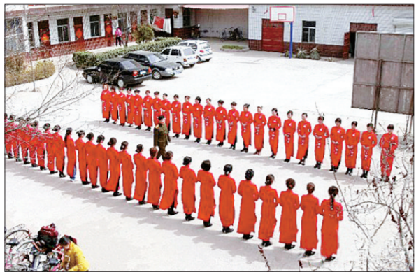
魏县选拔160名女教师做梨花节礼仪小姐

对于挑选教师做礼仪小姐一事,《梨乡礼仪培训纪实》中这样描述:“县委、县政府高度重视,梨花办的同志们不辞辛苦,从全县