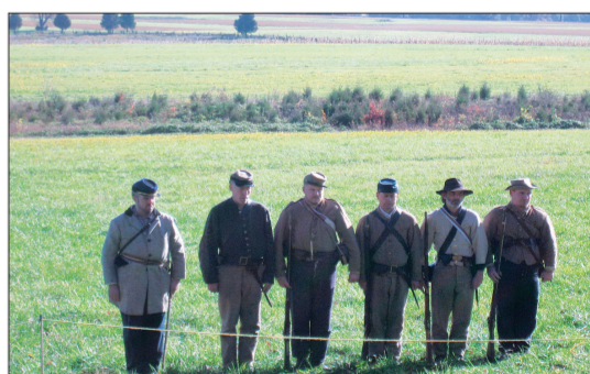
公园志愿者的当年军人模仿秀吸引着公园游客