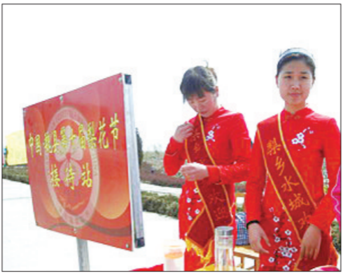
“梨花小姐”被分派到本届梨花节的20个景区

教育战线选拔160名形象好、素质高、责任心强、年轻教师作为礼仪、导游,有序地进行业务知识与技能的培训,并特聘了县人武部的教官进行军事化训练。”