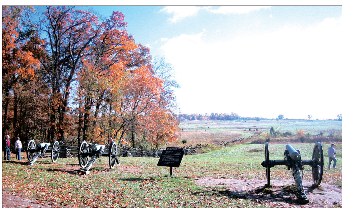
南北战争时期遗留的武器