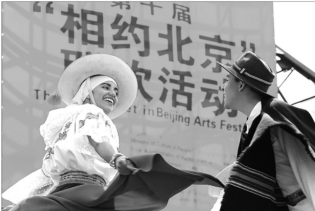
“五一”期间，作为第十届“相约北京”广场联欢演出之一的第五届朝阳流行音乐周在北京朝阳公园举办。图为美国杨翰翰大学“在世传奇”舞蹈团为观众献上充满美洲民族风格的歌舞表演《四季》。