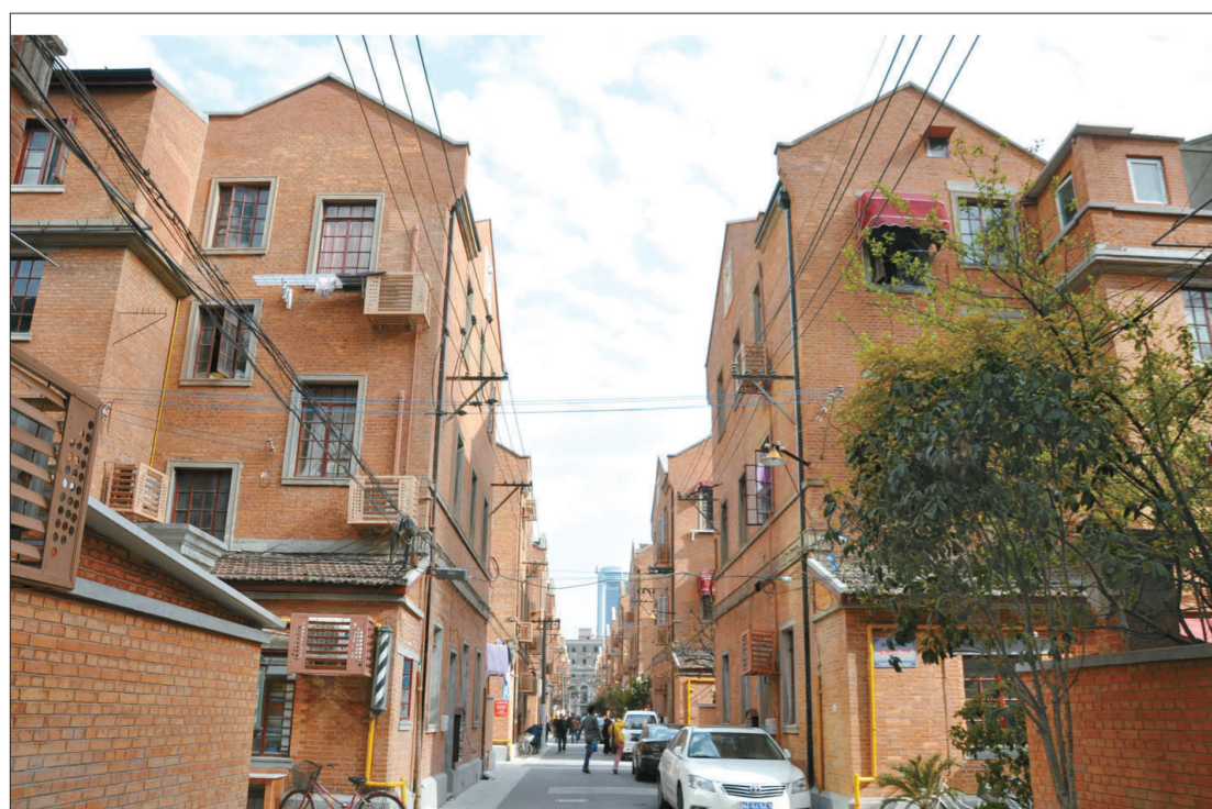
修缮后的上海静安别墅

上海静安建筑装饰实业股份有限公司是一家有着50余年开发经营、施工管理经验的资深建筑装饰企业,公司拥有中、高级职称工程技术人员300多名,具有房屋建筑工程施工总承包一级、建筑装修装饰工程专业承包一级、建筑装饰工程设计、建筑幕墙工程施工、机电设备安装工程和市政公用工程施工专业承包等企业资质。