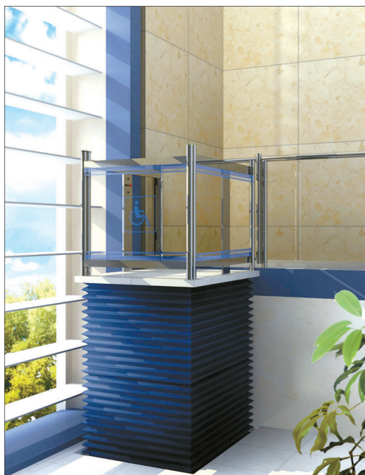
由该公司设计、生产的世博村酒店式公寓内升降平台。