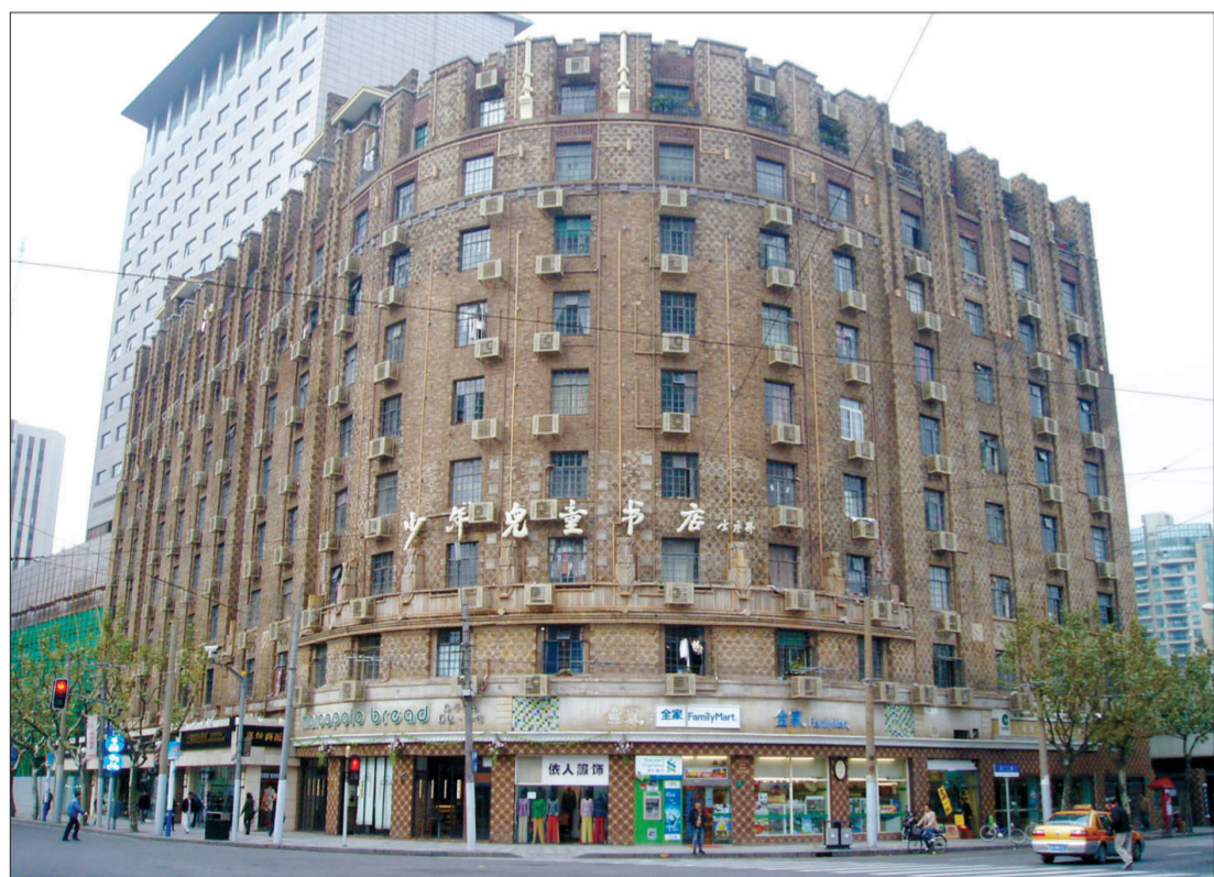
修缮后的上海德义大楼