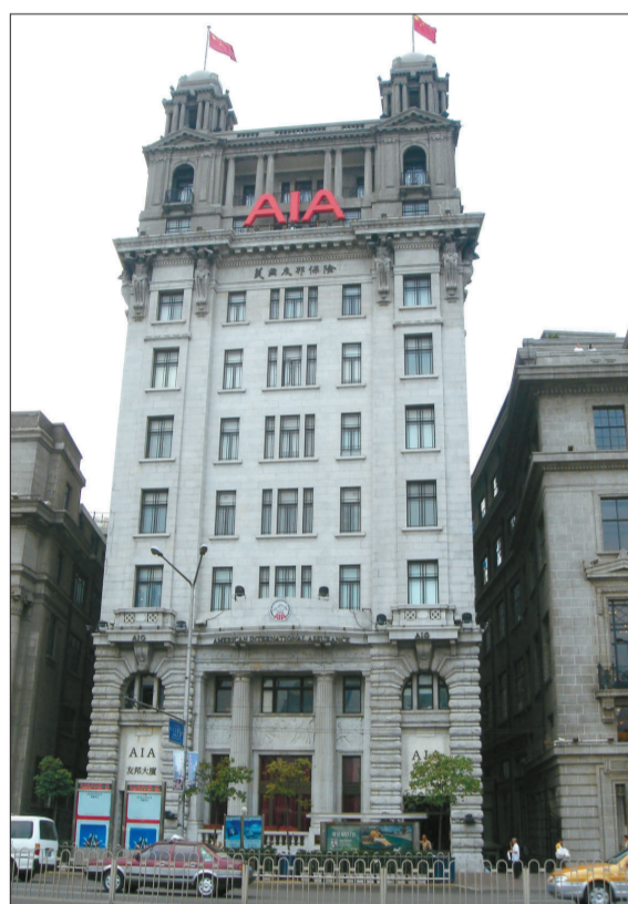
修缮后的上海外滩友邦大厦