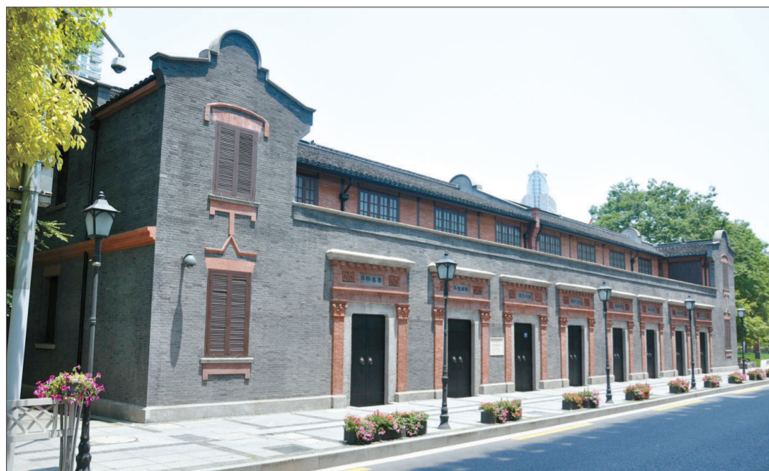
修缮后的中共二大会址纪念馆