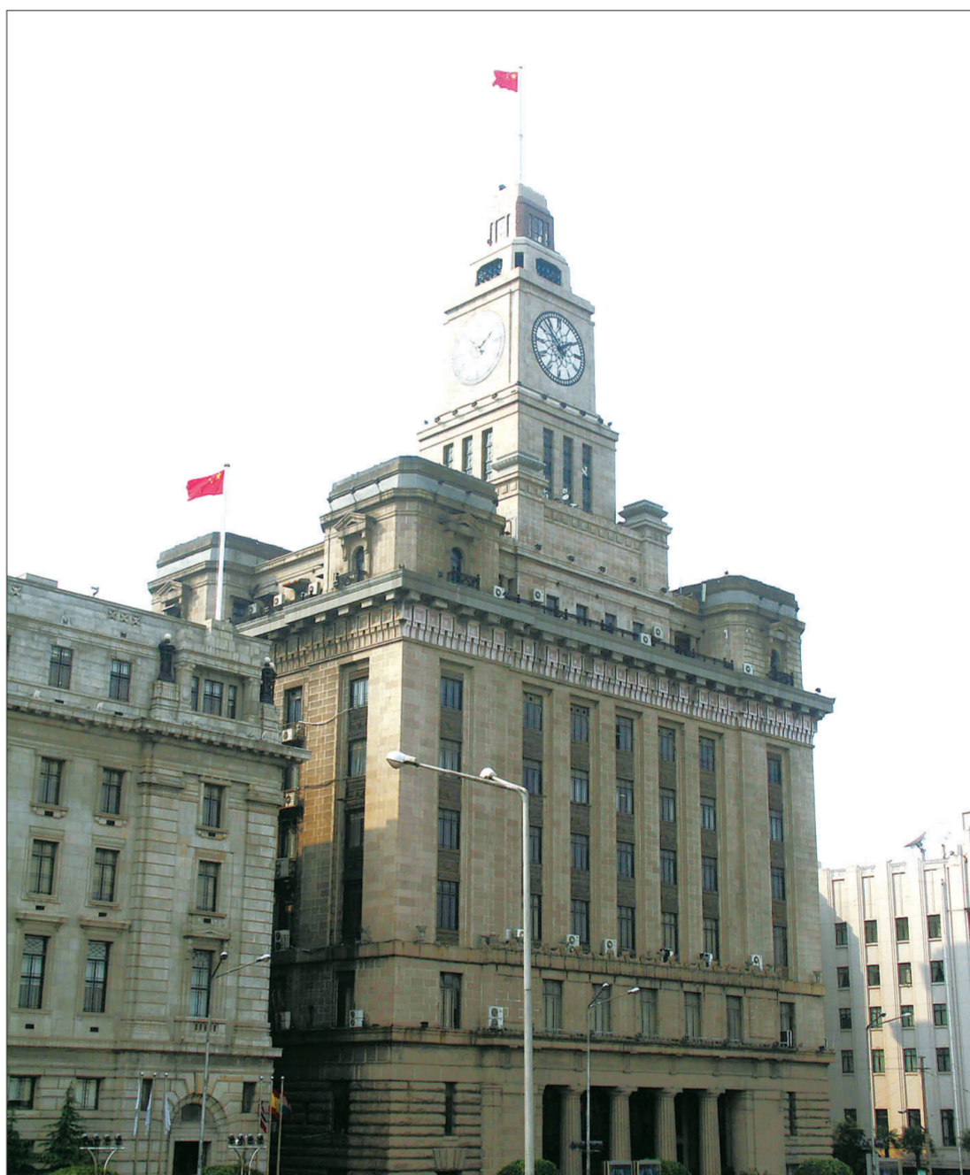
整治修复后的上海外滩海关钟楼

上海新静安建筑材料有限公司代理的“绿可”木产品符合世博的主题思想“城市让生活更美好”。“绿可”生态木景观配套产品中的户外地板系列产品的自然性能可以有效减少阳光的反射,吸收紫外线和红外的辐射,赋予应用部位以活力,并成为明亮而开放的空间;“绿可”生态木户外地板能使混凝土上的空气温暖凉爽,具有调节温度的效果,雨水可以从地板间隙流入地面,有着良好的排水性和透气性;“绿可”生态木地板安装简单,谁都能完成组装拼接式地板,真正实现DIY的梦想。