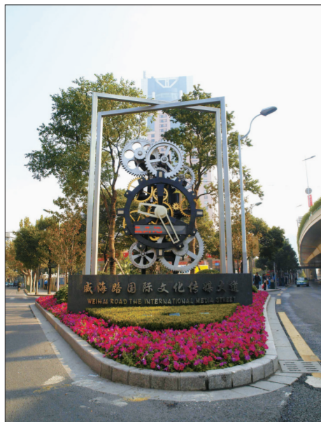
导入口标识——世博钟