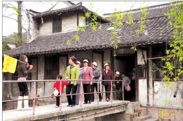
老街——民居——小桥流水——私家花园，这一民居格局为新场所独有。