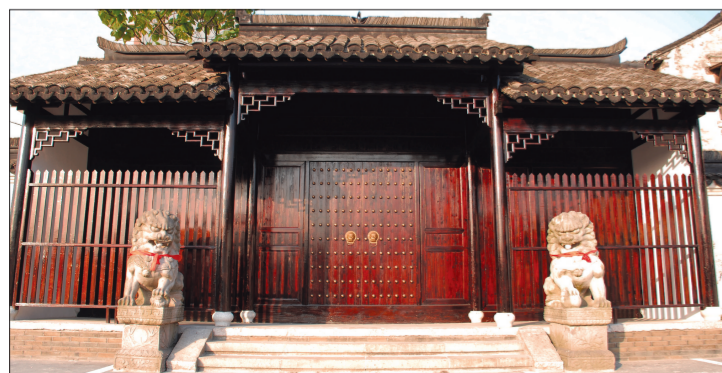
宋代起，新场开始淤积海盐，元代初年，即有浙盐运司署松江分司驻在新场，当时的盐产量为浙西27个盐场之首。