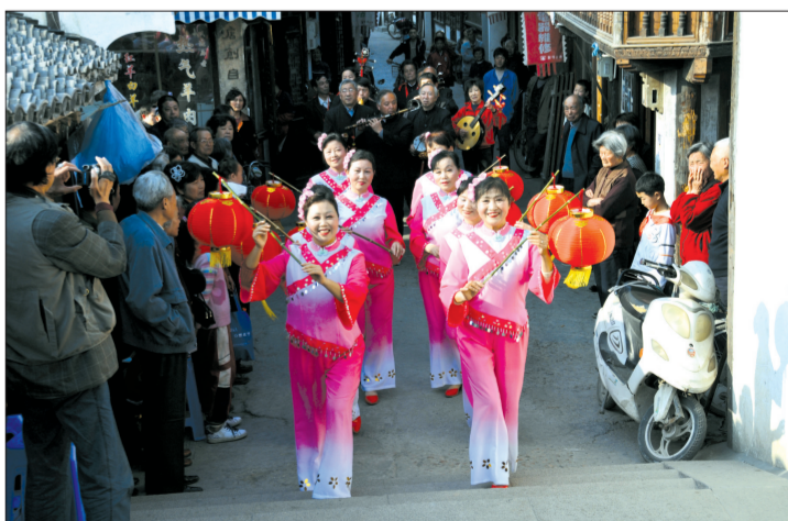
农历三月廿八新场庙会时的行街队伍。