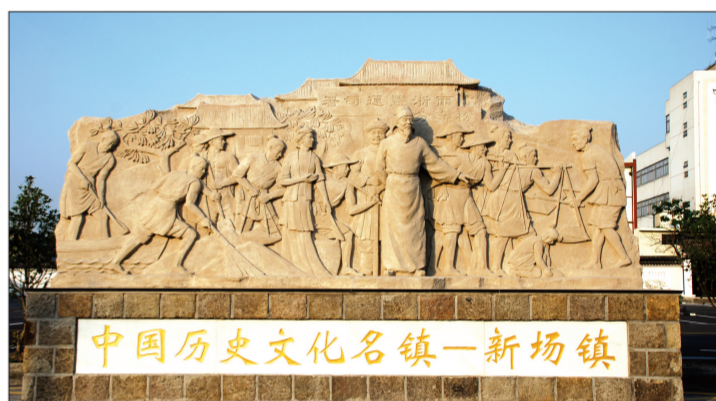
古镇新场2008年被评为“中国历史文化名镇”。