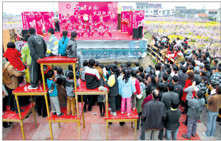
新场是上海桃花节的主要景点之一，每年桃花盛开的时候，四方宾朋云集新场，赏花踏青，游览古镇。