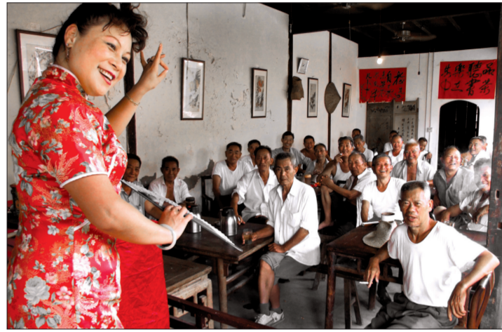
花上两元钱就能在第一楼茶园喝茶、听书。