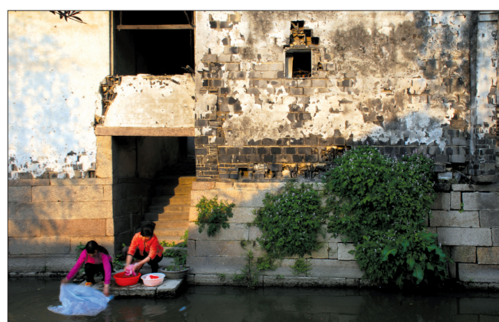
“门前连街市，窗外闻檐声”，极富诗意的老屋至今原汁原味地保存着原来的韵味。