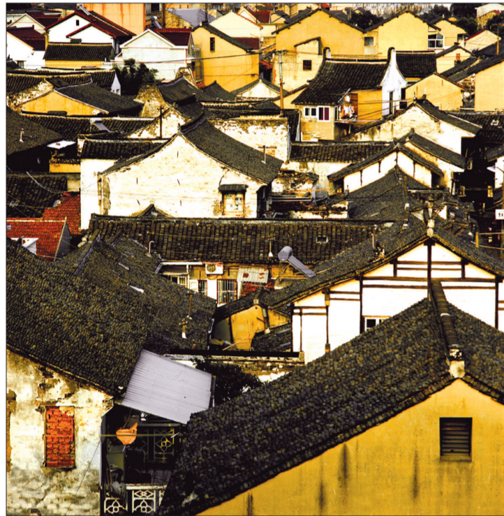
新场镇现存保存着连片的古民居15万平方米，图为洪西街一角。