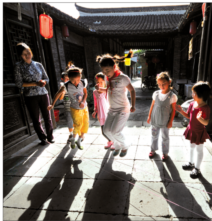
古镇中的孩子在老屋庭院里跳橡皮筋。