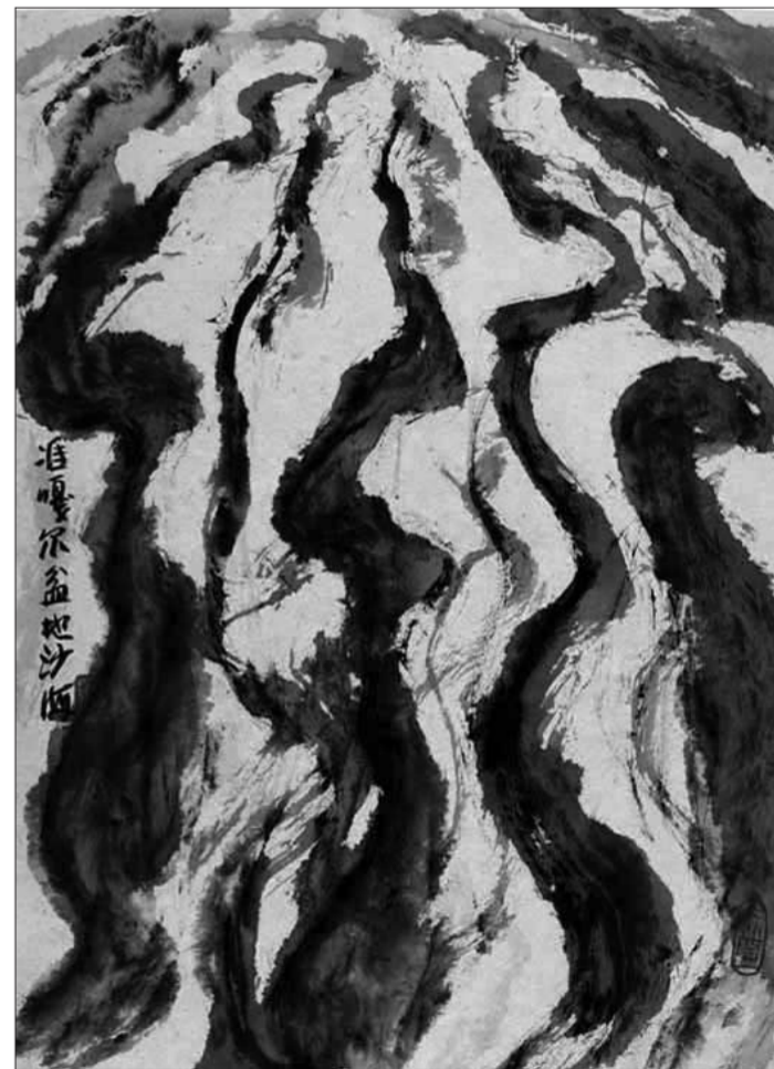
展期: 7月10日至8月16日 展地: 上海明园艺术中心

传统水墨如何在当今的艺术领域生存和发展,一直是水墨画界探索的重要主题,许多从事现代艺术创作和研究的艺术家也对“新水墨”给予了极大关注。他们的实践和思考拓展了水墨画的领域,从而形成了一个“开放的水墨画时空”。