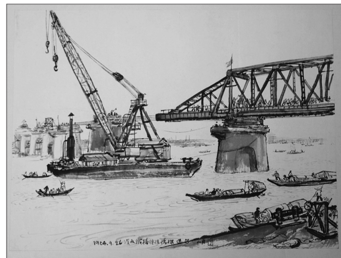
展期: 7月6日至8月8日 展地: 武汉美术馆

本次展览的全部展品都是从关山月美术馆馆藏中精选出来的关山月代表作,包括大量写生作品以及与其相关的山水创作,也有新中国成立后描绘祖国山河的画作。展出作品61幅。