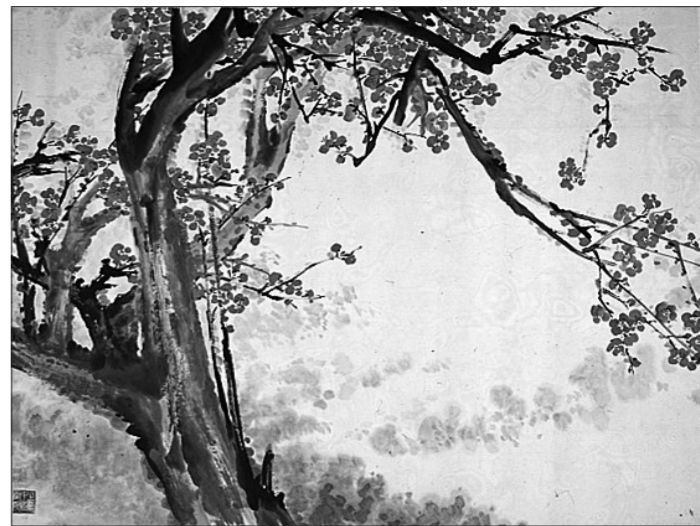
展期: 7月12日至24日 展地: 上海美术馆

出生于1910年的唐云先生曾担任中国美术家协会上海分会副主席,上海中国画院代院长、名誉院长。作为海上画坛的巨匠,其山水、花鸟、人物兼擅,风格俊逸潇洒,笔墨清健明润,尤以隽雅清丽的花鸟画别开生面,别树一帜,成为海上花鸟画坛不可或缺的艺术大家。