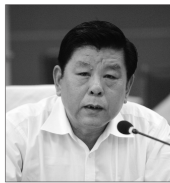
胡振民(中国文联党组书记、副主席):

中共中央总书记胡锦涛同志7月23日在主持中共中央政治局集体学习时强调,文化是民族凝聚力和创造力的重要源泉,是综合国力竞争的重要因素,是经济社会发展的重要支撑。要求我们一定要从战略高度认识文化的重要地位和作用,以高度的责任感和紧迫感,顺应时代发展的要求,深入推进文化体制改革,推动社会主义文化大发展大繁荣;号召广大文化工作者和文化单位要自觉践行社会主义核心价值观体系,坚持社会主义先进文化前进方向,始终把社会效益放在首位,坚决抵制庸俗、低俗和媚俗之风;要求我们创作生产更多无愧于时代、无愧于人民的精品,最大限度发挥文化引导社会、教育人民、推动发展的功能。广大文艺工作者要深入学习、全面贯彻落实胡锦涛总书记的重要讲话精神,高举旗帜,围绕大局,服务人民,改革创新,积极呼应党和国家的号召,向以吴冠中为代表的优秀艺术家群体学习,不断攀登艺术高峰,努力成为德艺双馨的人民艺术家,为社会主义文化大发展大繁荣做出积极的贡献。