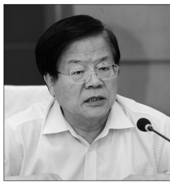
蔡武(文化部党组书记、部长):

今天,文化部和文联隆重召开吴冠中纪念座谈会,缅怀和学习一代艺术大师德艺双馨的崇高风范和执著坚定的艺术精神。