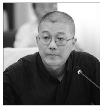
许江(中国美术学院院长):

吴先生虽然离我们而去,但他无私奉献、勇于创新的精神却永远留在我们心中,他宝贵的艺术财富也将激励我们为祖国的美术事业和艺术教育事业不断的努力。