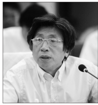
范迪安(中国美术馆馆长):