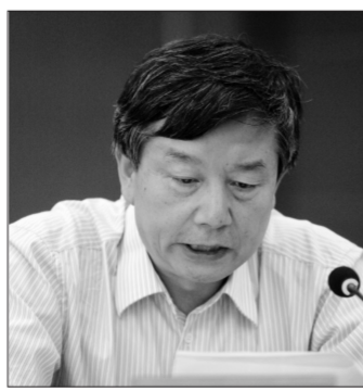
吴长江(中国美术家协会分党组书记、常务副主席):

我深深敬佩他的学识、修养和人格魅力。我们曾多次一起外出写生画画,住小旅馆,甚至大车店。他身材瘦小,却劲劲十足。朴实、倔强的性格造就了一代大师坚持、真情的艺术。