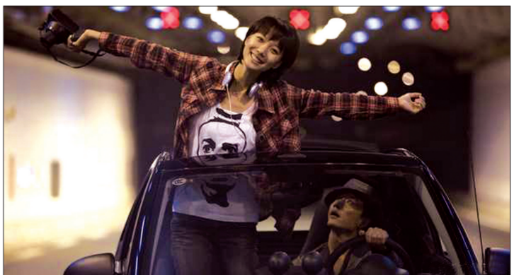
电影《无人驾驶》剧照