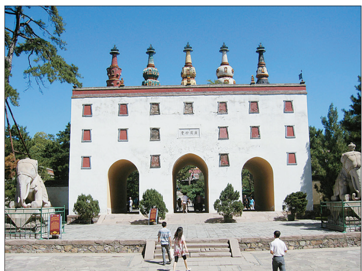
承德小布达拉宫

承德拥有我国现存最大的皇家园林——避暑山庄,雄伟壮观的寺庙群——外八庙、长城之精华——金山岭长城、清代皇家猎苑——木兰围场等人文和自然景观,文物古迹荟萃,自然风光秀丽,民俗风情浓郁,并形成了以世界文化遗产为核心,森林、草原、温泉、冰雪、山水相环绕的旅游资源布局。