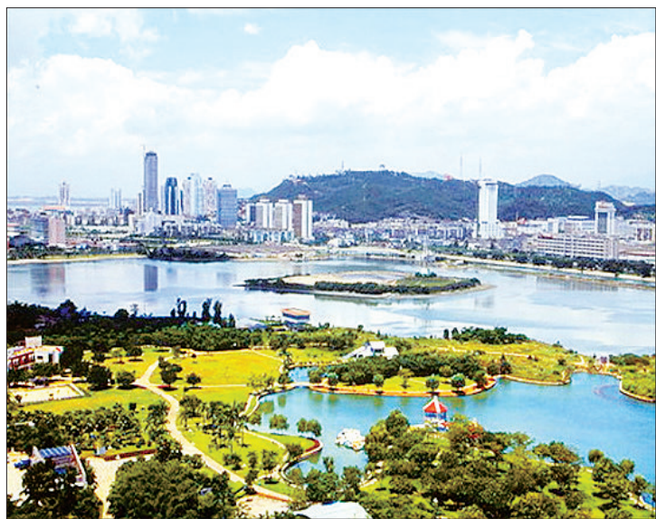
远眺唐山南湖城市中央生态公园

据唐山市园林规划部门的工程师介绍,这片矿区经历了一个多世纪的连续开采,渐渐成为采煤沉陷区。2007年,沉陷区达28平方公里,相当于3000余个足球场大小。沉陷的大坑最深近20米,污水横流、垃圾如山,一遇大风天,煤矸石的粉末遮天蔽日,几米内只闻声不见人。1976年唐山大地震之后,唐山市每天约700吨的城市生活垃圾全都倾