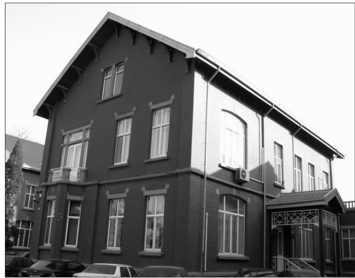
中央文史馆书画院美术馆外观

12月1日,“‘大道同行——海峡两岸中国画艺术展’汇报展”在京举行。就在去年11月底,“大道同行——中央文史馆书画院特展”作为该画院艺术联展中的首个展览在北京时代美术馆开幕时,曾引起了广泛关注。有所不同的是,此次,伴随着展览开幕,中央文史研究馆书画院美术馆在筹备一年后宣告开馆。饶宗