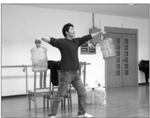
小品《寻找男子汉》排练现场