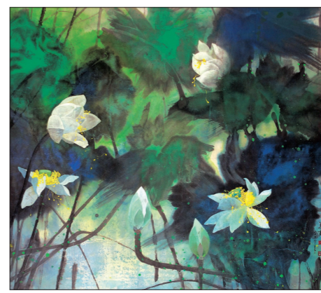
荷塘盛景(国画) 袁运甫

此次展览的学术主持陈丹青认为,在现代中国艺术流派中,有一类区别于徐悲鸿先生“为人生而艺术”和刘海粟先生“为艺术而艺术”的学术主张,即工艺美术前辈自始抱持未经命名的“第三主