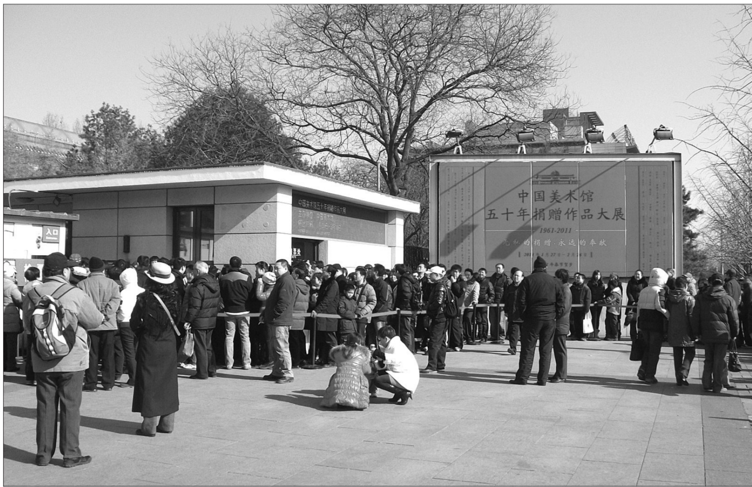
观众在中国美术馆门外排队领票等候入馆观展

记者注意到,各地区、各级美术馆的免费程度不同。在美术评论家陈履生看来,其主要原因在于中国经济社会发展不均衡以及