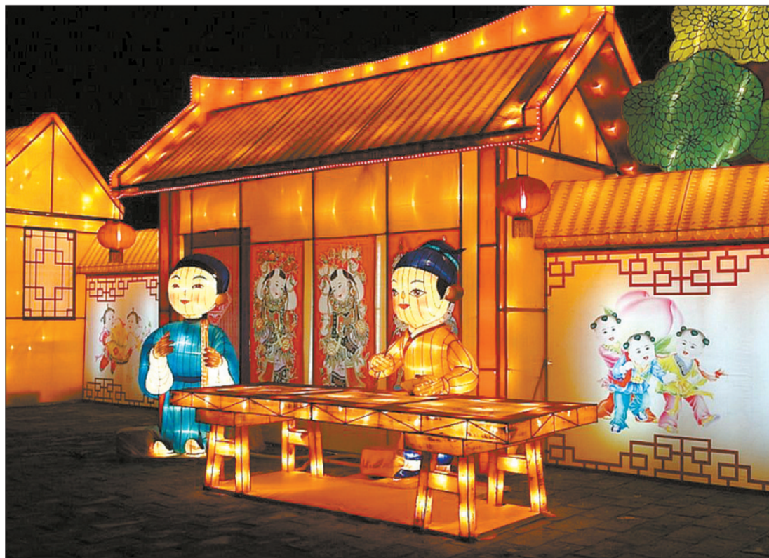
2011年秦淮灯会以中华传统文化为主题

三里屯国际时尚街区灯会的看点为传统的“兔儿爷”灯笼展示。12组印有“灯彩江湖”各种字体的异型创意灯笼,将在Village主要广场展示。另外,在橙色大方阵“姓灯方阵”“至亲方阵”“提灯方阵”“排灯方阵”“艺术表演方阵”等组成。周、许、庄、高……大红灯笼高高提的“姓灯方阵”是万人游灯中的一大亮点,折射了异彩纷呈的姓氏文化,又反映了宗族繁衍的脉络。