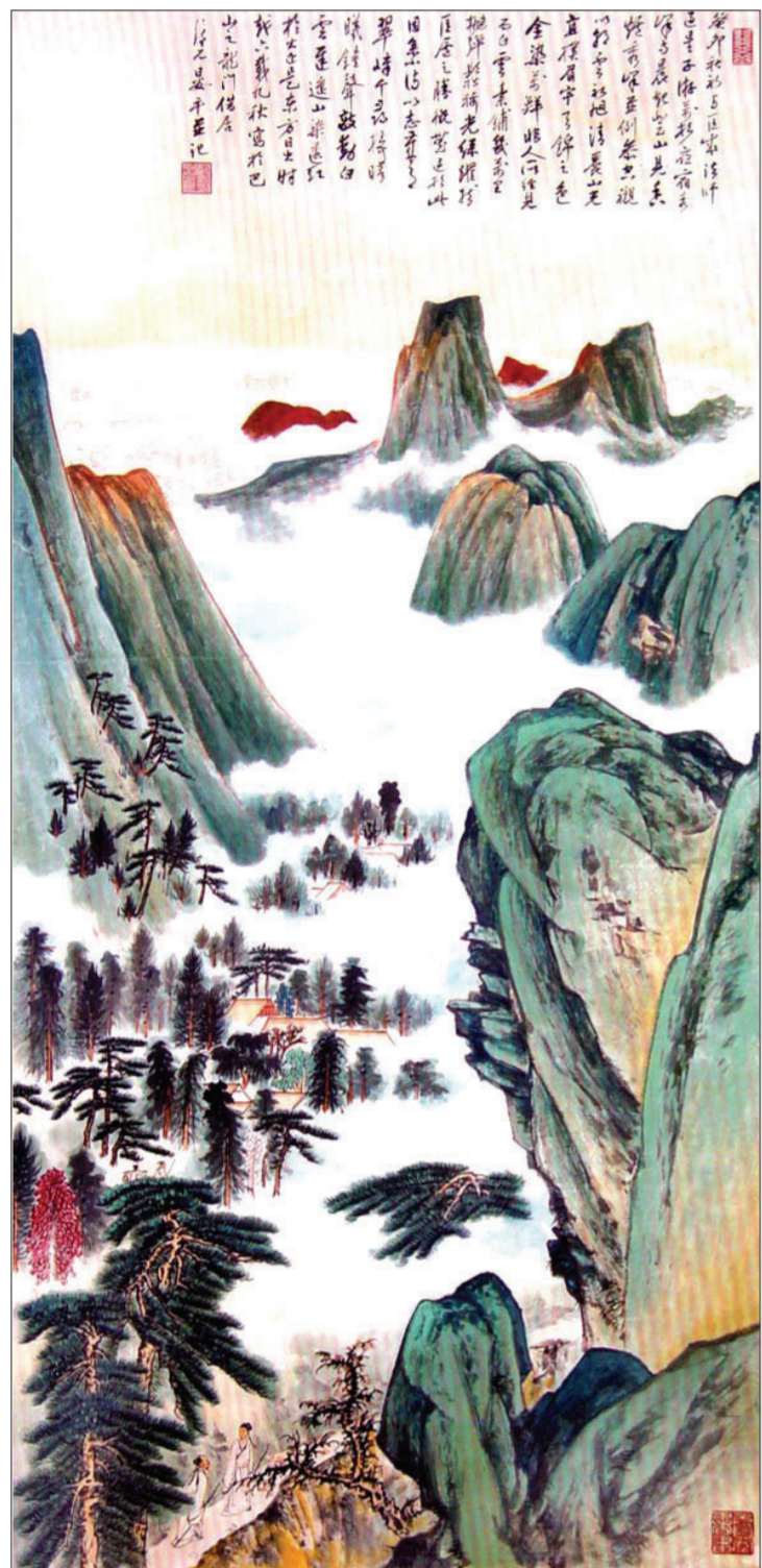
▲庐山云海(国画) 136厘米×69厘米 1963年 晏济元