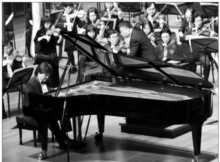
第二届“中国交响乐之春”