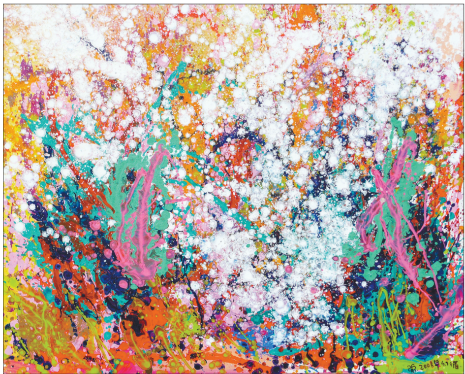
织春(油画) 200厘米×100厘米