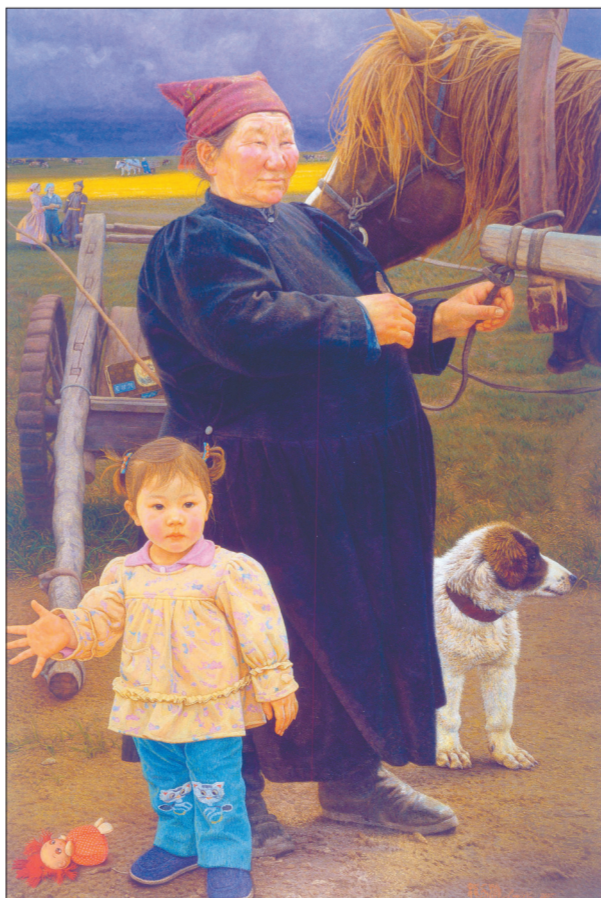
胖奶奶(油画) 140厘米×30厘米

我有意在画布上营造出有如贝多芬的交响乐,自由、恬适又热情奔放;兼有诗意般的闲适、预约的笔触的肌理美。作品中辽阔的大草原往画里延伸,产生了纵深感,微妙柔和;远处背景中的牛羊与草地的衔接过渡自然,虚实相生,又给人以空灵之感。