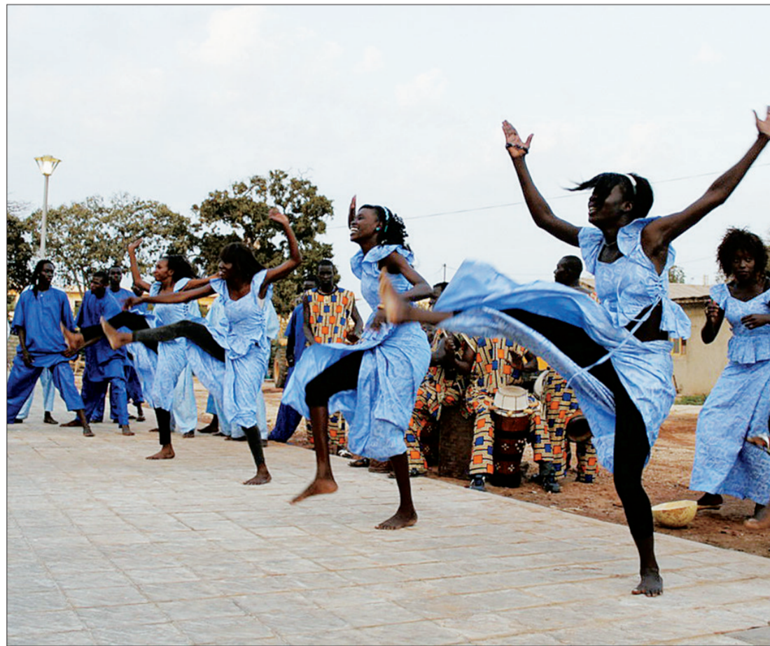
演出开始前,塞内加尔民间艺术团在广场上热身。

据了解,这是中国中医专家首次走出贝宁经济首都科托努举办讲座和交流活动,活动受到了当地同行及民众的欢迎和好评,大家积极参与讨论,交流场面十分热烈。甚至还有观众询问,中国针灸专家在贝宁的哪家医院工作,以便能够去该医院接受治疗。整个交流活动进行了近两个小时,大家还是感到意犹未尽,纷纷表示希望此类活动能够多举办。(宁文)