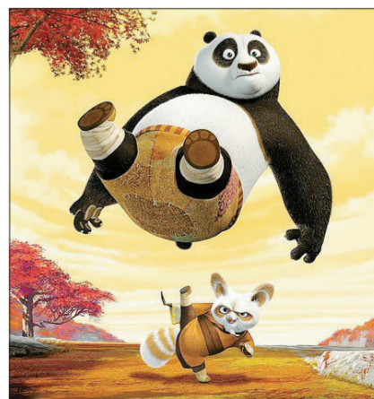
熊猫阿五很郁闷:“我功夫最差的时候,师父都没有放弃我,现在我功夫已经很好了,怎么会招人厌呢?”(该设计图)

这只是中国与国外文化产业差距中一个典型例子:我们的元素都被别人拿去了,我们只是跟脚叫骂却无高招。虽然我们也在加大力度,但还是因为浮躁心理与仅重表面而导致仍然落后。我以为现在的关键不是抵制问题,而是如何批判地学习它、深入地研究它、努力地超越它!